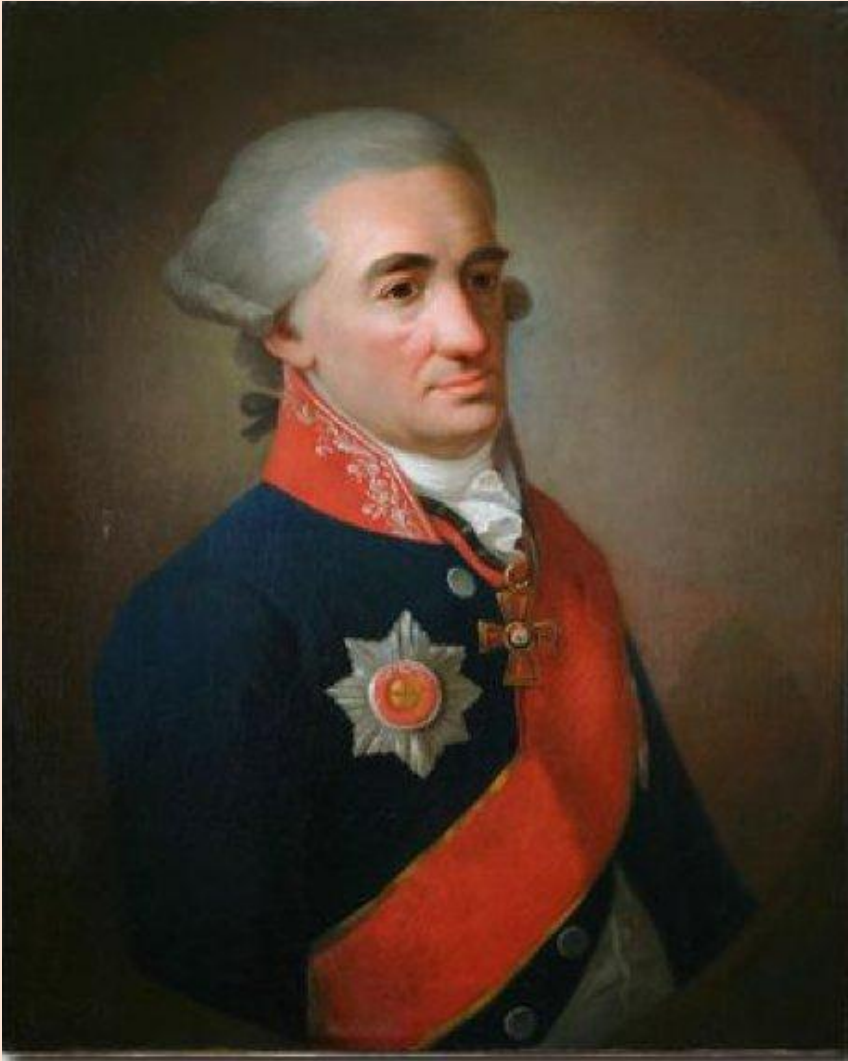
Михаил Матвеевич Херасков (1733-1807)

«Желаний никогда своих не умеряем; Имея что-нибудь, мы лучшего желаем»