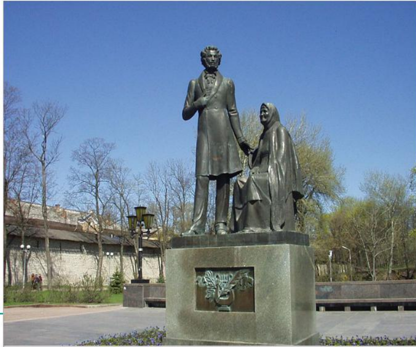
Памятник А. Пушкину и его няне в Пскове.