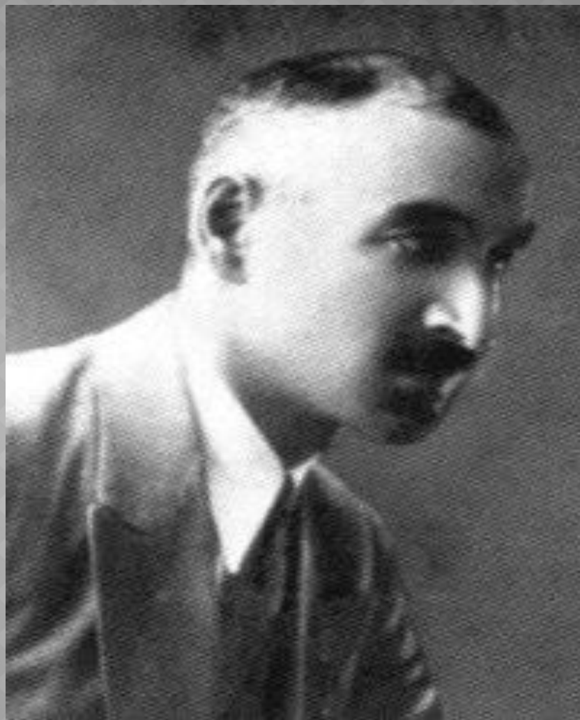
ИЛАС Ф. РНИГОН