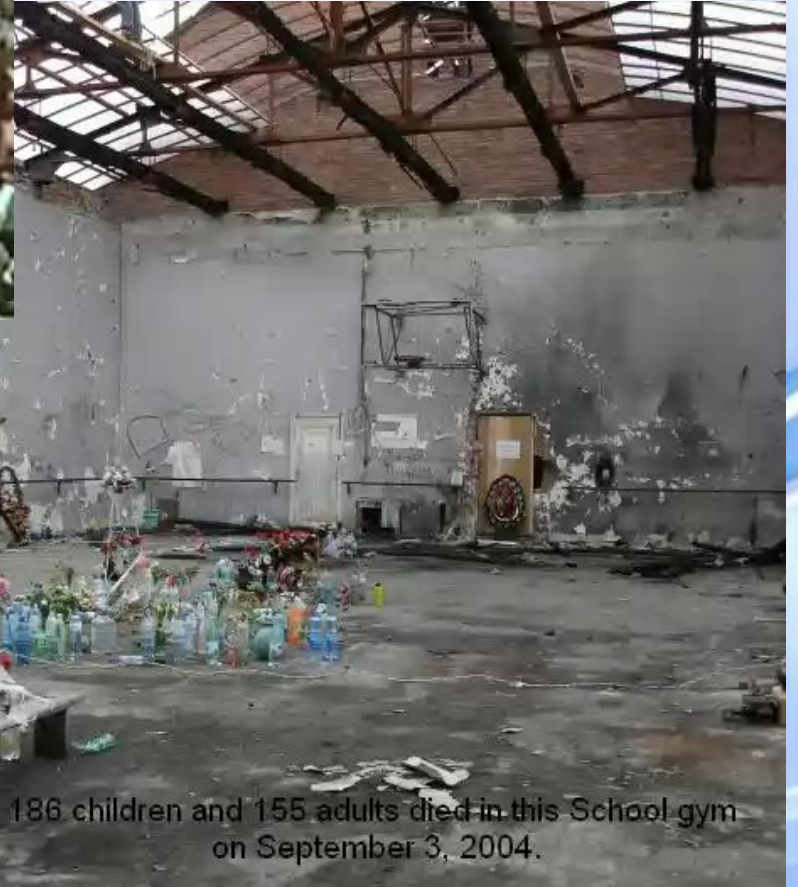
186 children and 155 adults died in this School gym on September 3, 2004.