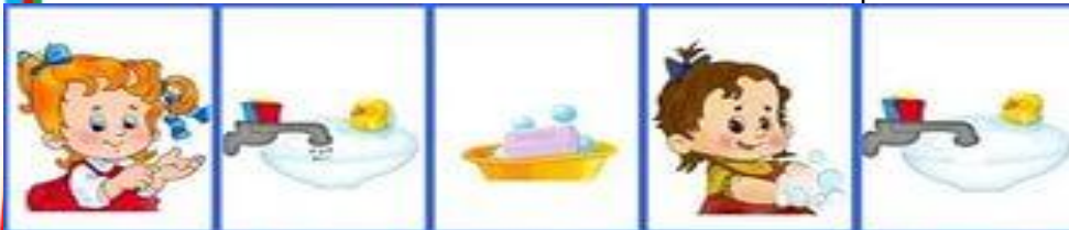
закатываем рукава открываем кран берем мыло намыливаем руки закрываем кран