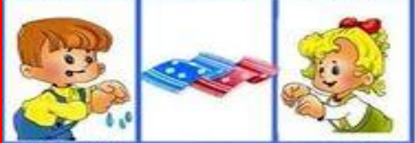
отжимаем руки вытираем опускаем рукава