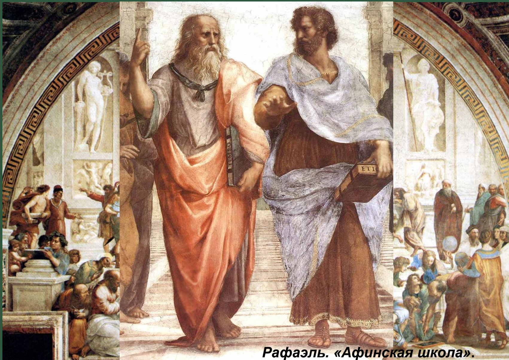
Рафаэль. «Афинская школа».