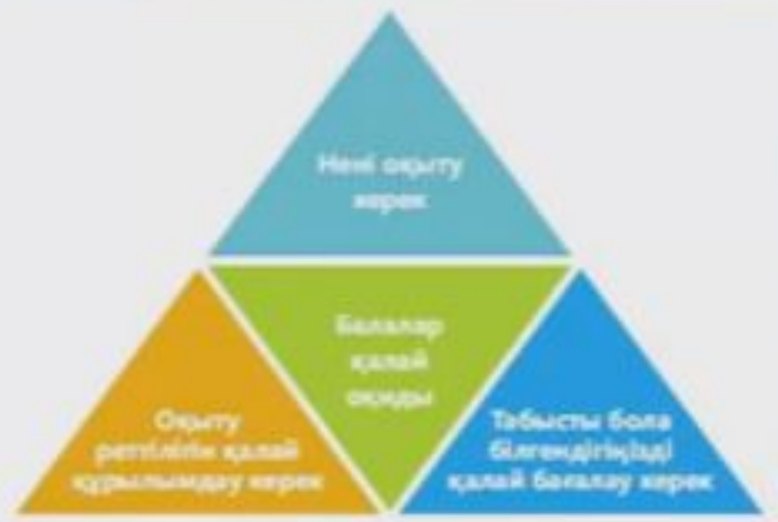
1) Балаларға қалай оқу керектігін үйренуге көмектесу