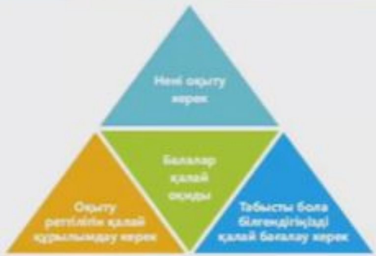
1) Балаларға қалай оқу керектігін үйренуге көмектесу