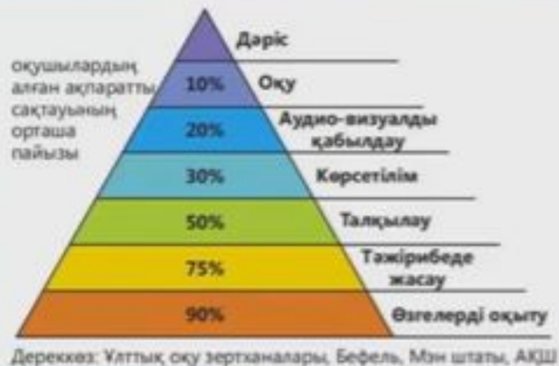
1) Оқу пирамидасы