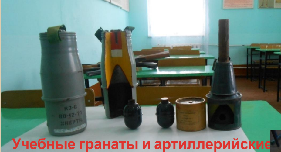
Учебные гранаты и артиллерийские снаряды