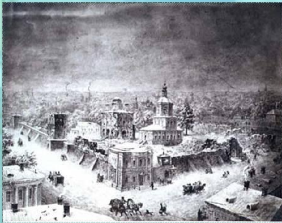
Богоявленский после пожара

Страшный пожар в мае 1773 года уничтожил по существу весь город. Для борьбы с огнем еще в XVIII в. было учреждено пожарное депо и выстроены деревянные каланчи, но последние подчас и сами загорались.