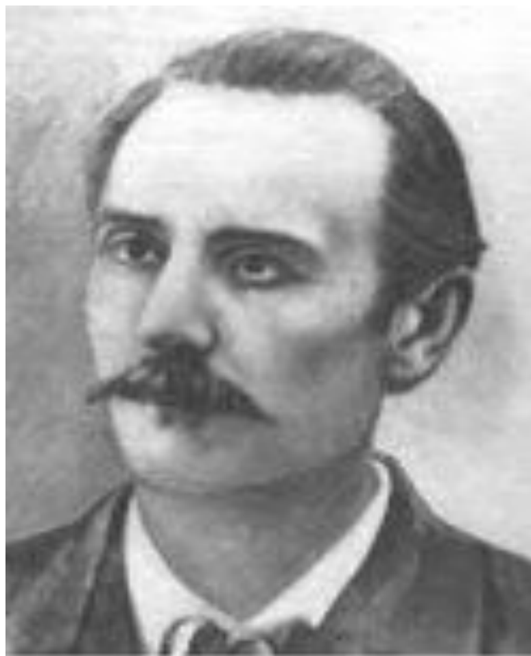
I. Gasprinskiy (1851-1914)