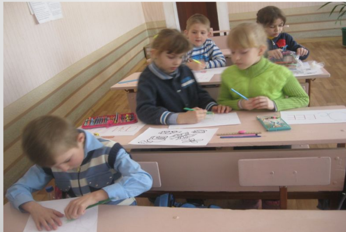
Кружок «Занимательная математика»