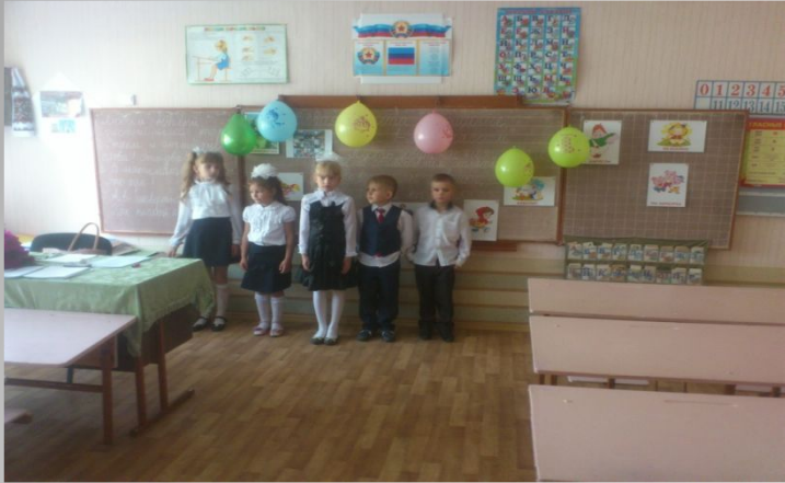
Прощание с 1-ым классом