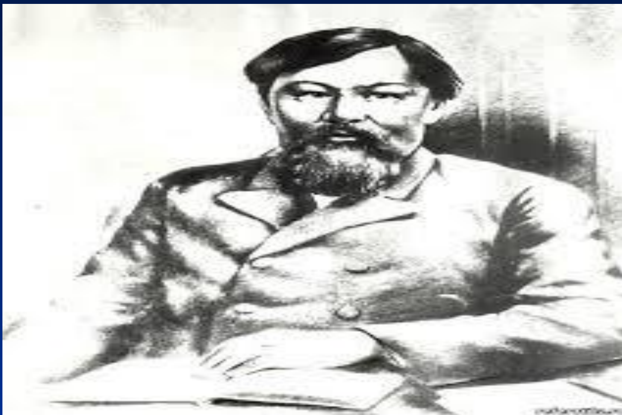
Ыбырай Алтынсарин 1841-1889