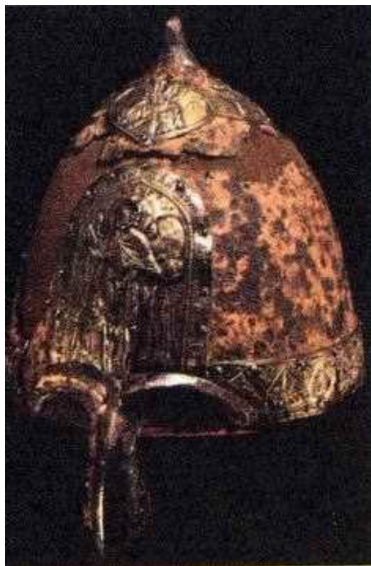
Шлем Ярослава Всеволодовича