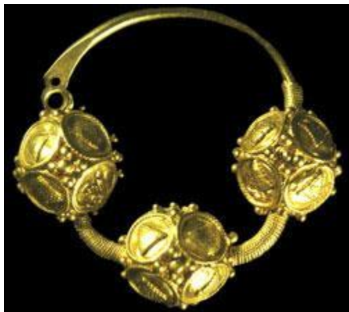
Сережка- подвеска XI-XIII ст.