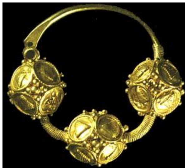
Бусина, украшенная зернью