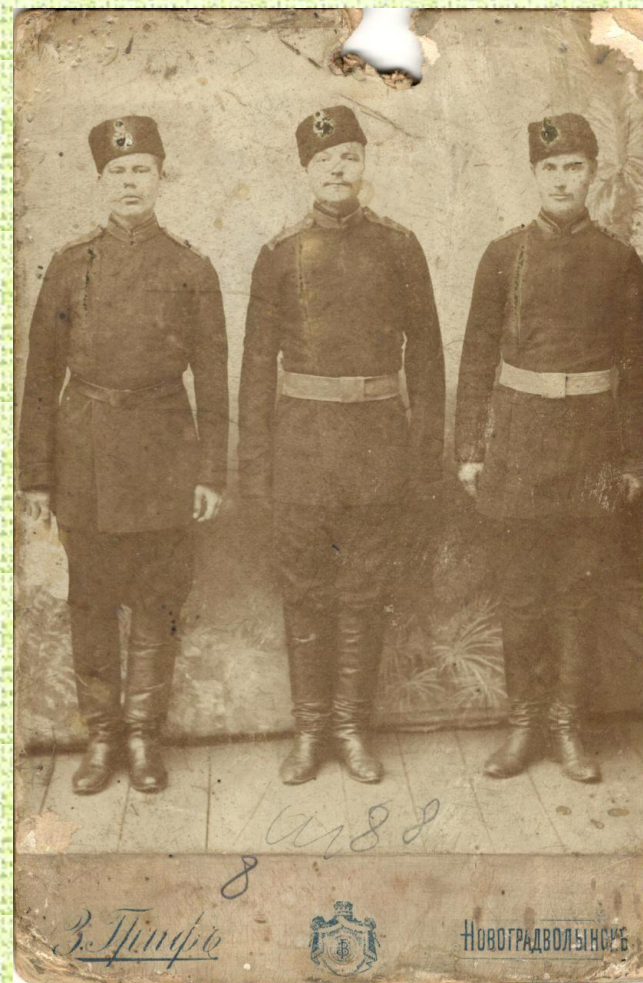
Фото из архива семьи Вьюновых жителей с. Ахмат Краснокутского района (1730г) (верхний справа – П. Шаткин)