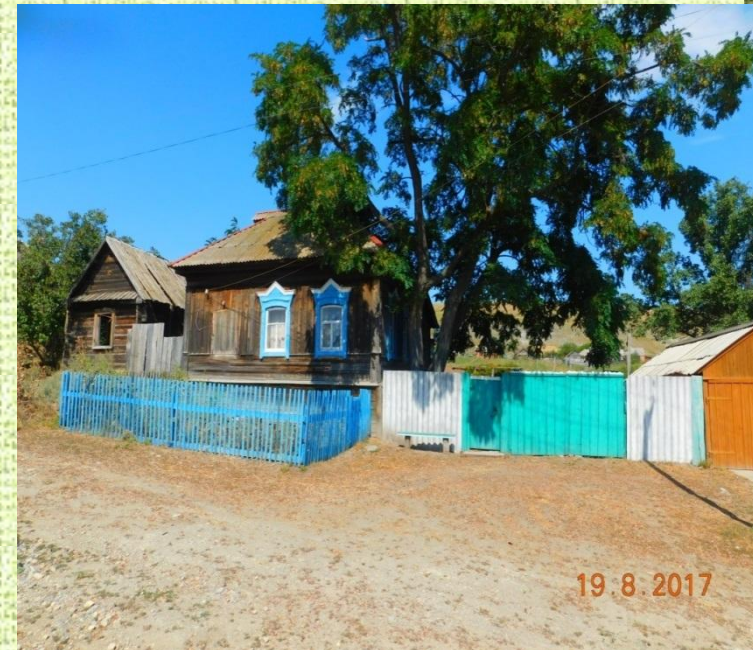
Дуб - символ в с. Ахмат