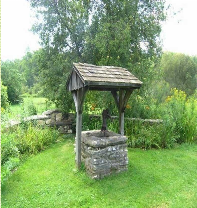
Колодец С. Танцарова - одного из основателей с. Ахмат Краснокутского района