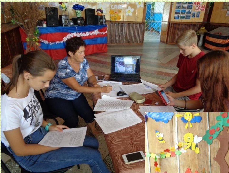
Первое заседание клуба «Краевед»