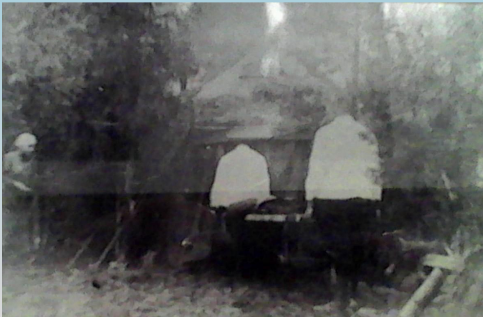
Поступление раненых в медико-санитарный батальон, 1942 г.