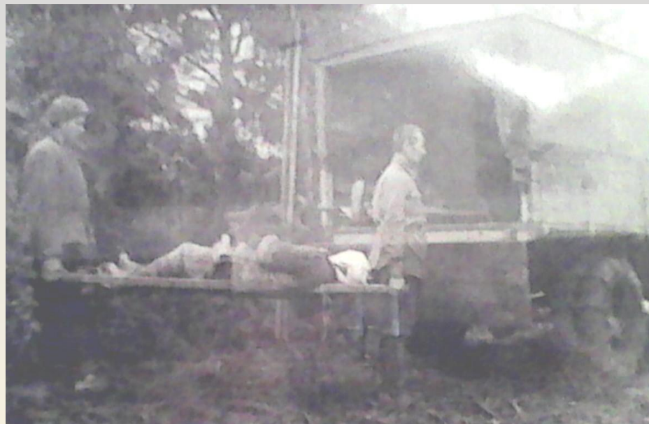
Погрузка раненых бойцов в медико- санитарный батальон, 1942г.