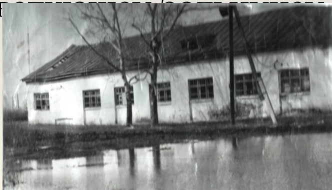
здание Макушинской районной Больницы (зерносовхоз Макушинский»)

Железнодорожная больница на 15 коек имела и родильное отделение. В ней работало 7 медсестёр, 2 врача, заведующей была Могилевская А.Г.