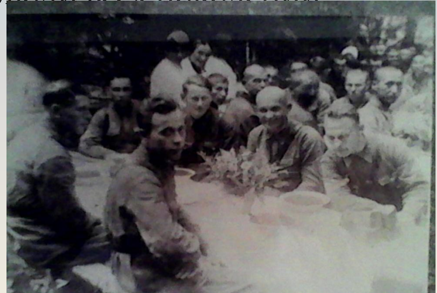
Обед в эвакогоспитале