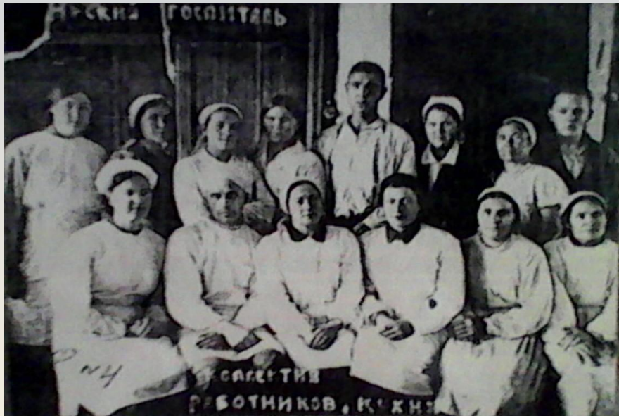
Работники кухни эвакогоспиталя № 3879