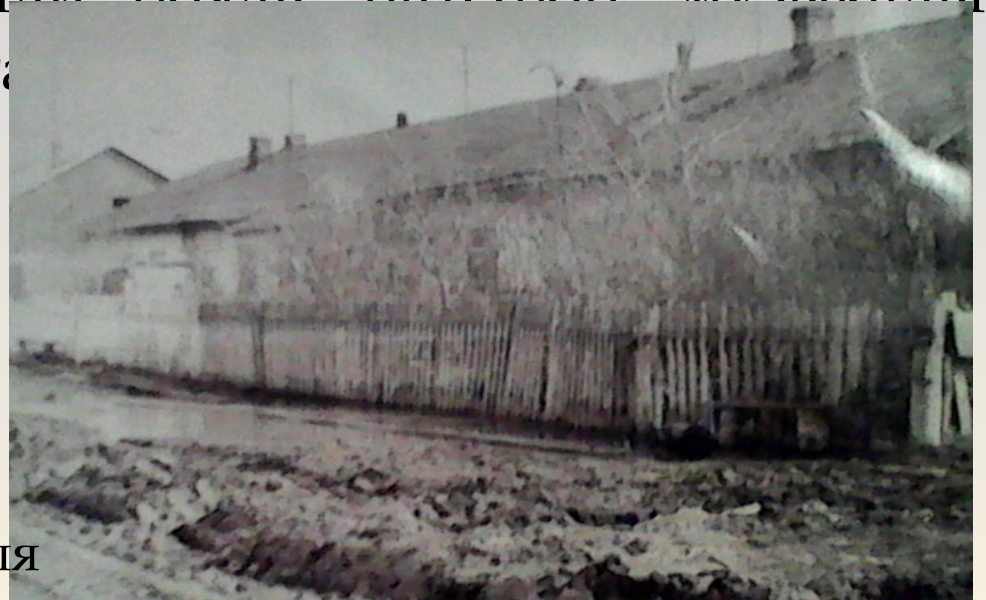
Один из корпусов госпиталя

Макушинский район тепло принял и госпиталь, и раненых воинов. Подарили войскам патефон, музыкальные инструменты, продукты, та