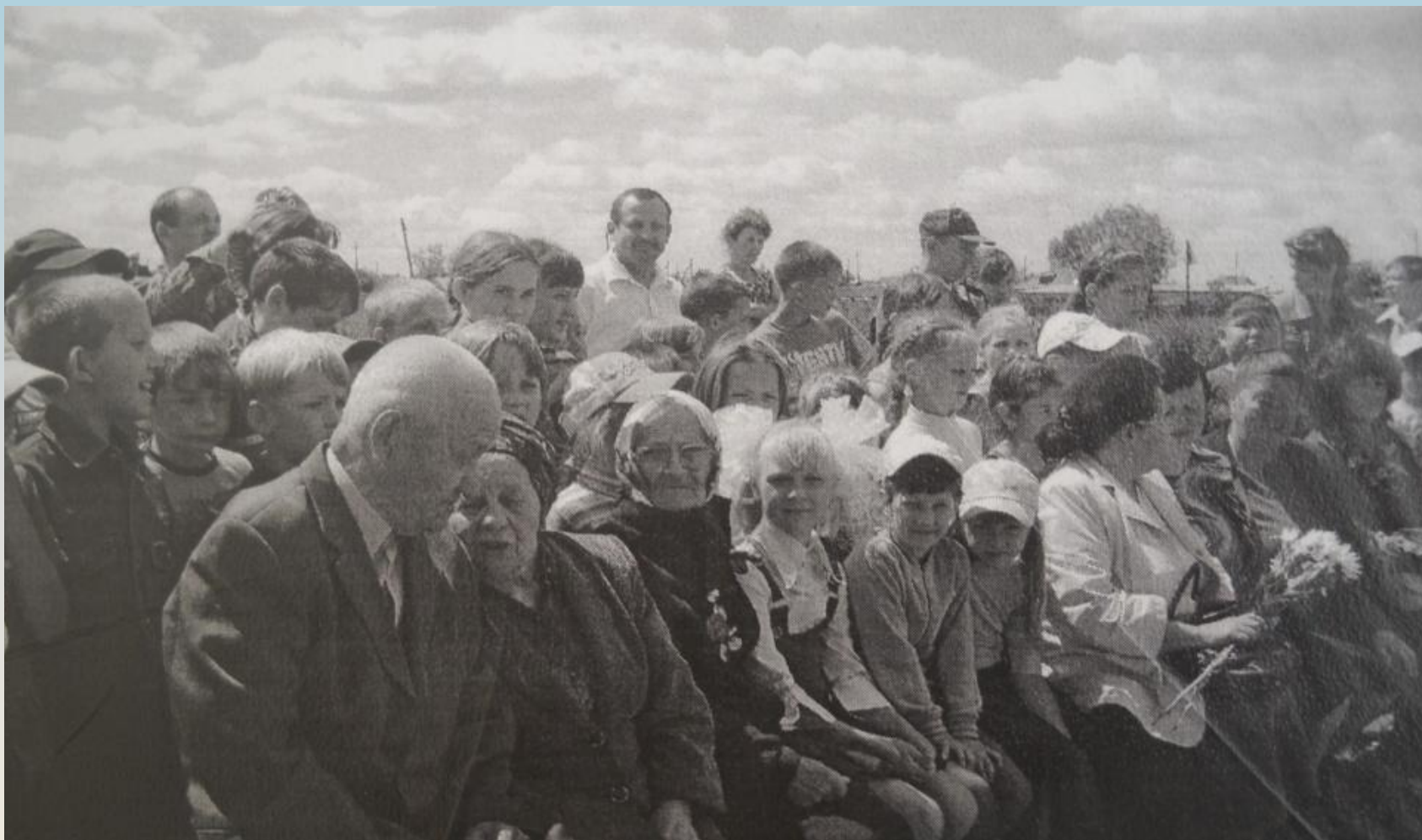
2010 г, Концерт посвященный памяти воинов , умерших от ран в эвакогоспитале