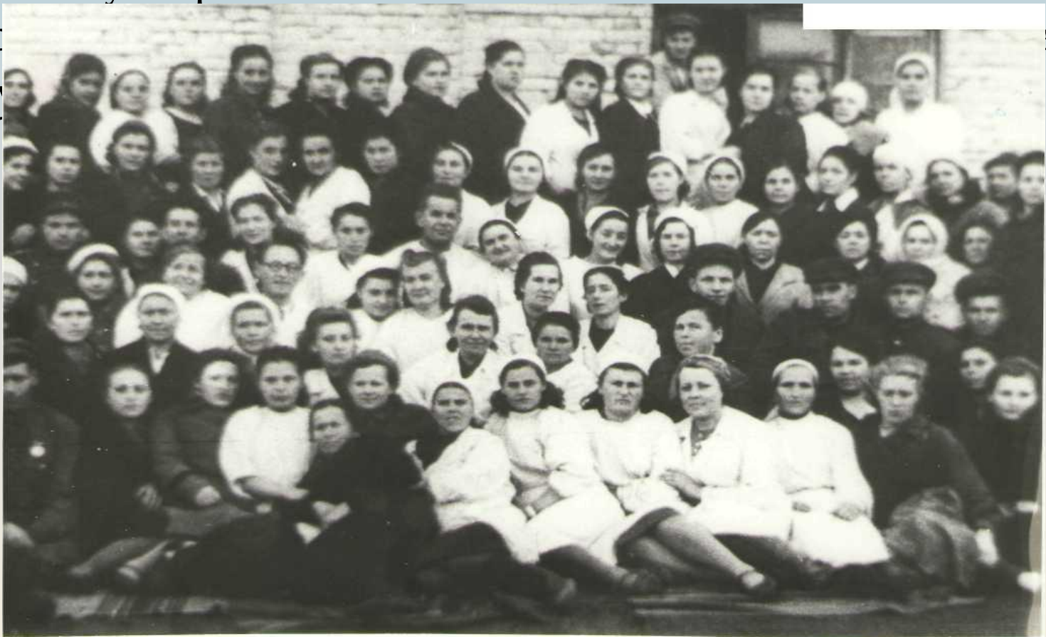
Коллектив эвакогоспиталя № 3879

В годы войны Приходилось работать на износ. Медицинская сестра была и перевязочной сестрой в процедурной, массажистом и няней. Весь медицинский персонал сдавал кровь. Помимо дежурства выполнял и другие работы, ездил на заготовку дров. И никогда они не пасовали перед трудностями. Поэтому