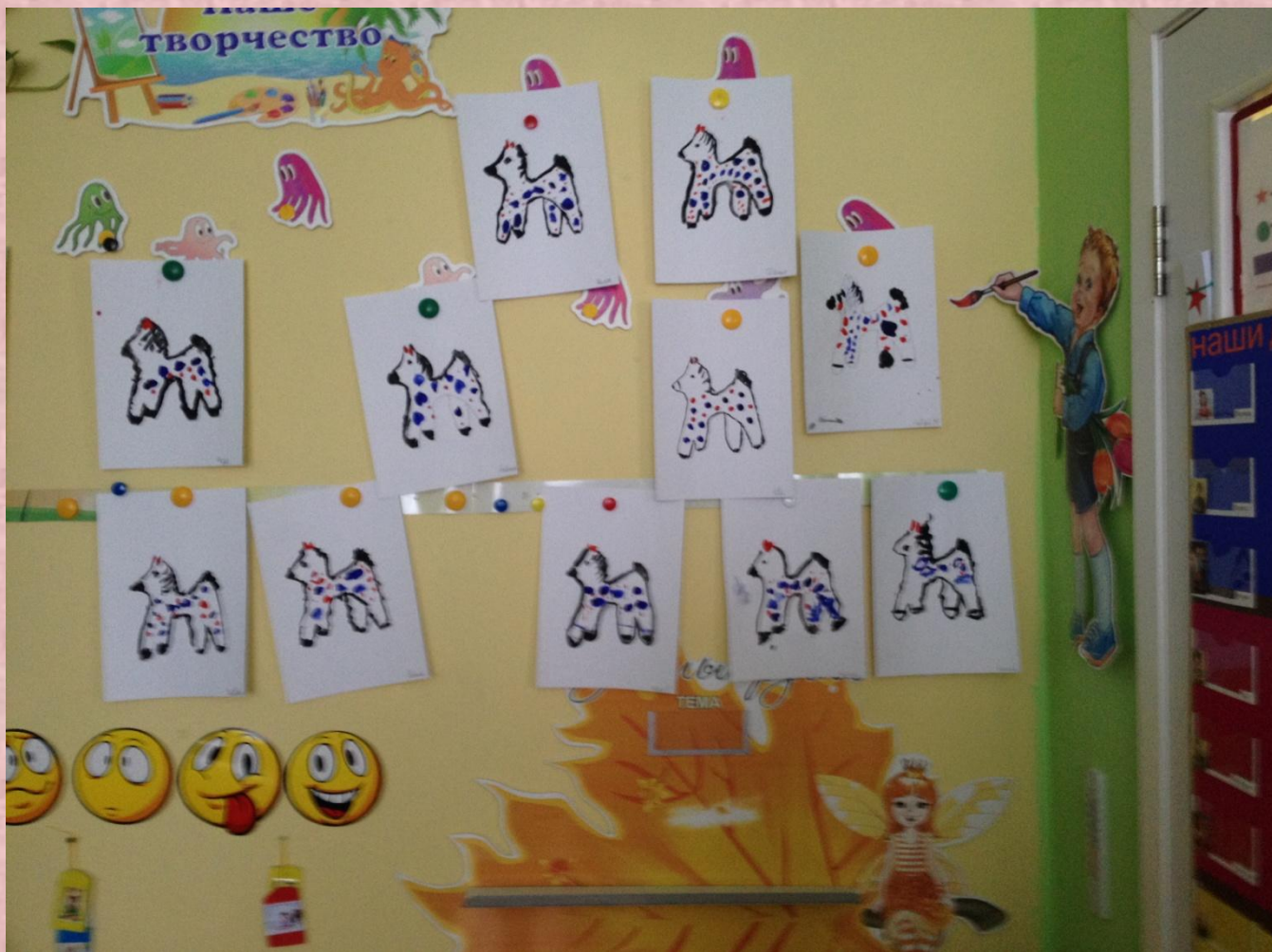
Выставка работ детей