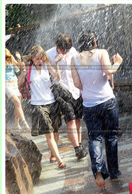
Люди под дождем