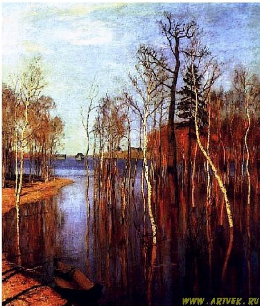
Левитан. Весна. Большая вода.

Весна! Весна! Как воздух чист! Как ясен небосклон. Своей лазурию живой Слепит мне очи он. Весна! Весна! Как высоко, На крыльях ветерка, Ласкаясь к солнечным лучам, Летают облака. Шумят ручьи, блестят ручьи, Взревев, река несёт На торжествующем хребте Поднятый ею лёд. Ещё древа обнажены, Но в роще ветхий лист, Как прежде, под моей ногой И шумен, и душист. Под солнце самое взвился И в яркой вышине Незримый жаворонок поёт Заздравный гимн весне. Е. Баратынский