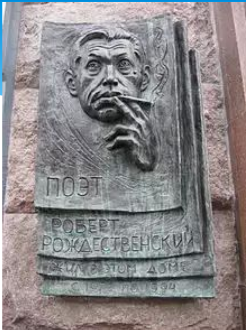
Памятная доска на доме в Москве, где жил Роберт Рождественский (установлена в 2012 году)