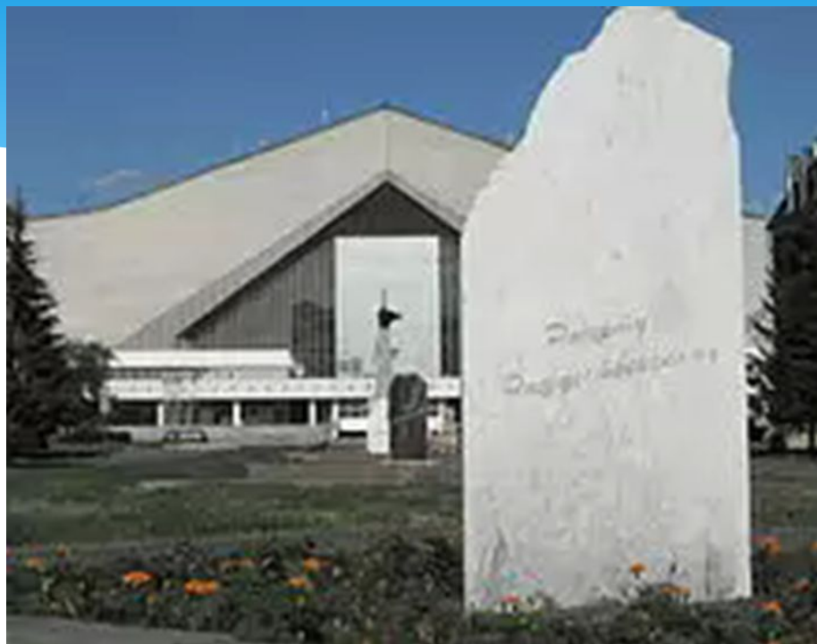
Мемориальный камень Р. Рождественскому в Омске