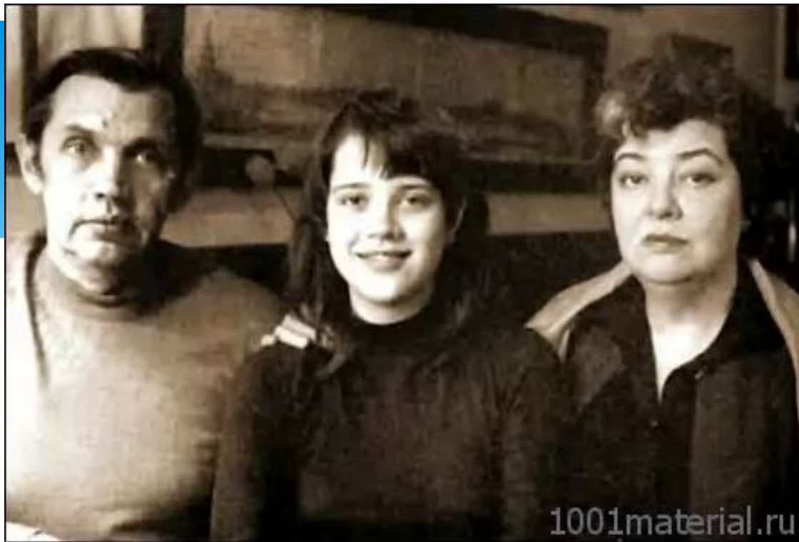
Семья Роберта Станиславовича Рождественского