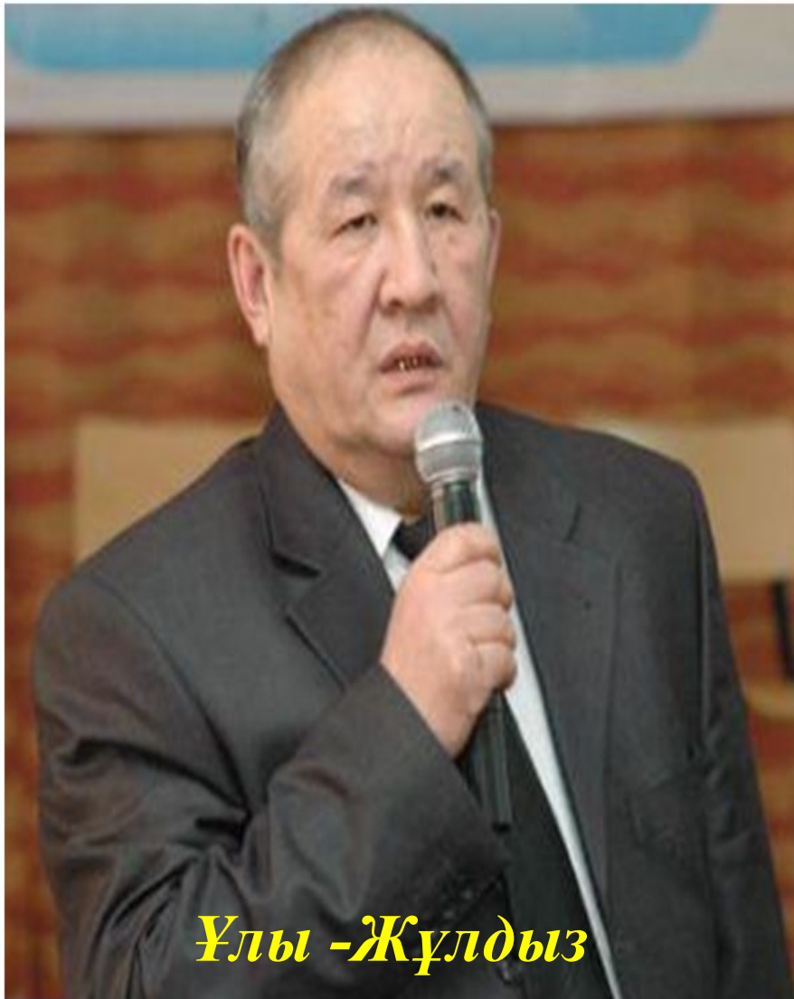
Ұлы - Жұлдыз