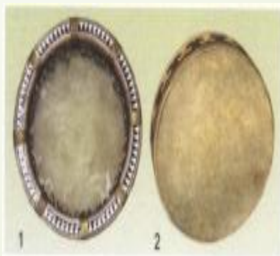
Дуңгур: 1 – с односторонней мембраной и подвесками; 2 – с односторонней мембраной