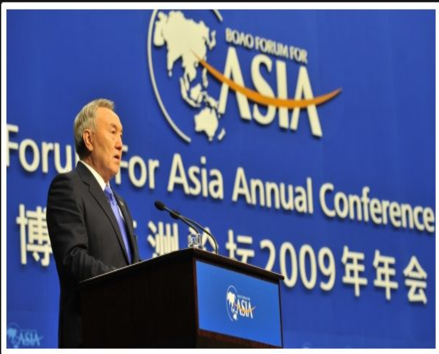
Қытайда сөз сөйлеген кезі, 2009 жылғы 17 сәуір.