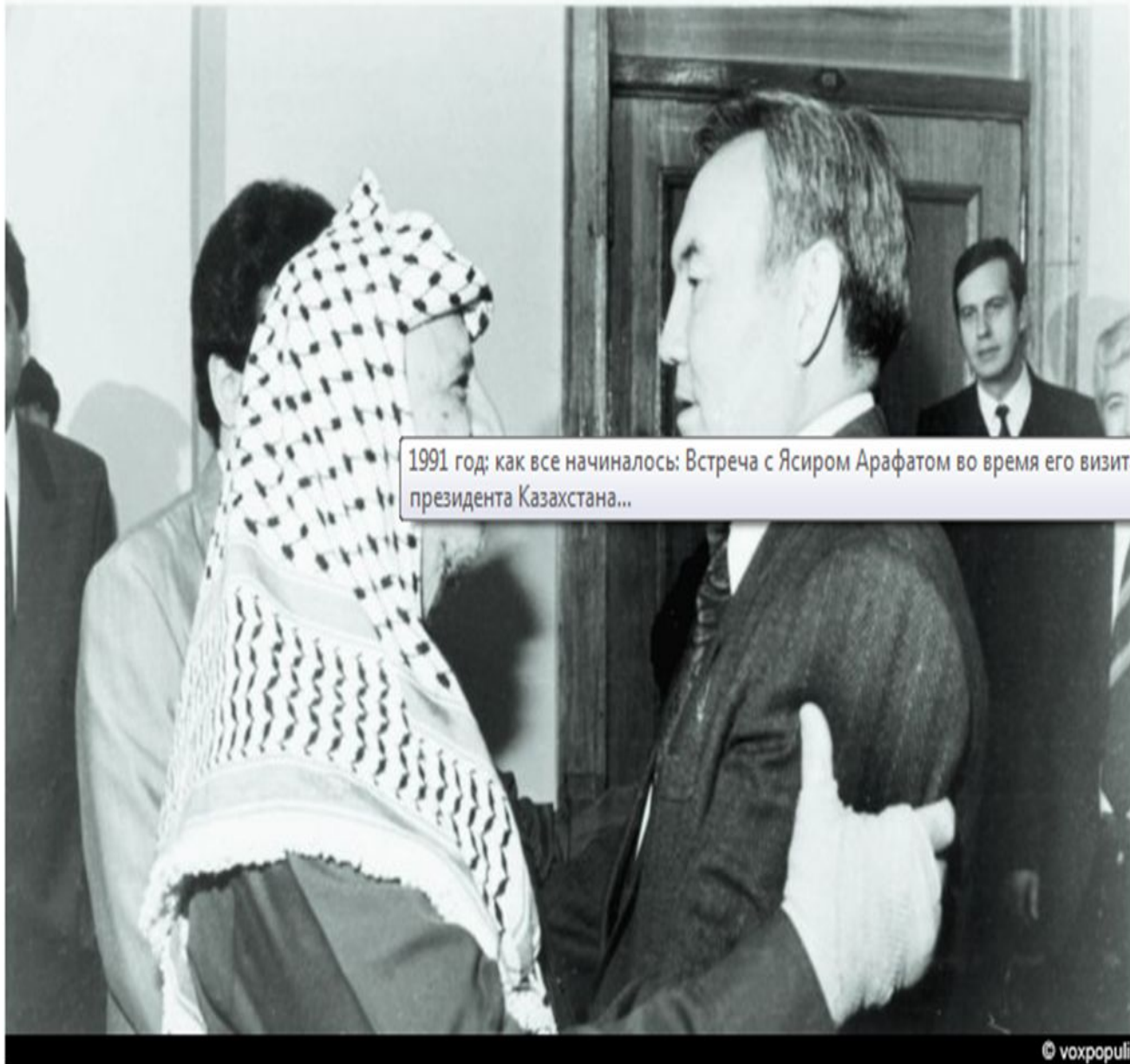
1991 год: как все начиналось: Встреча с Ясиром Арафатом во время его визита в Казахстан. Палестинский лидер призвал президента Казахстана...