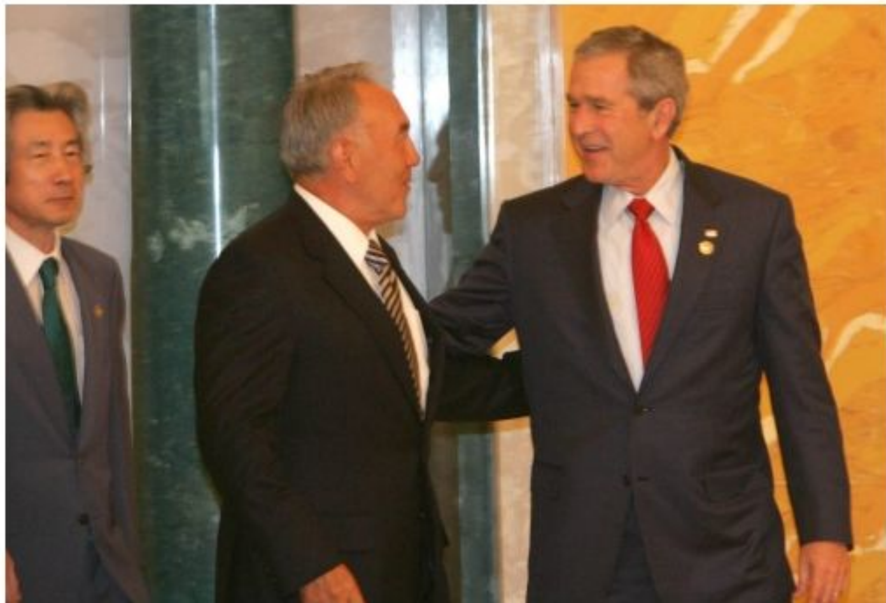
G8 форумы аясында Д.Бушпен кездесуі, 2006 жылғы 17 шілде.