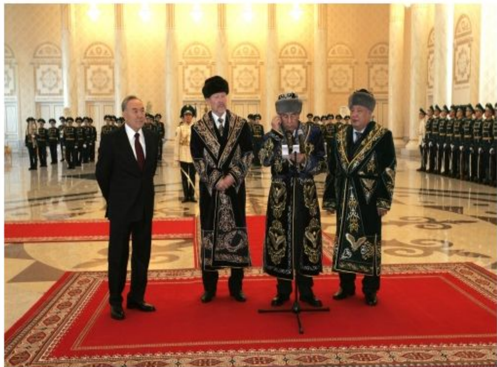
«Ақорда» Президент резиденциясының ашылу салтанатында ақсақалдар бата беруде