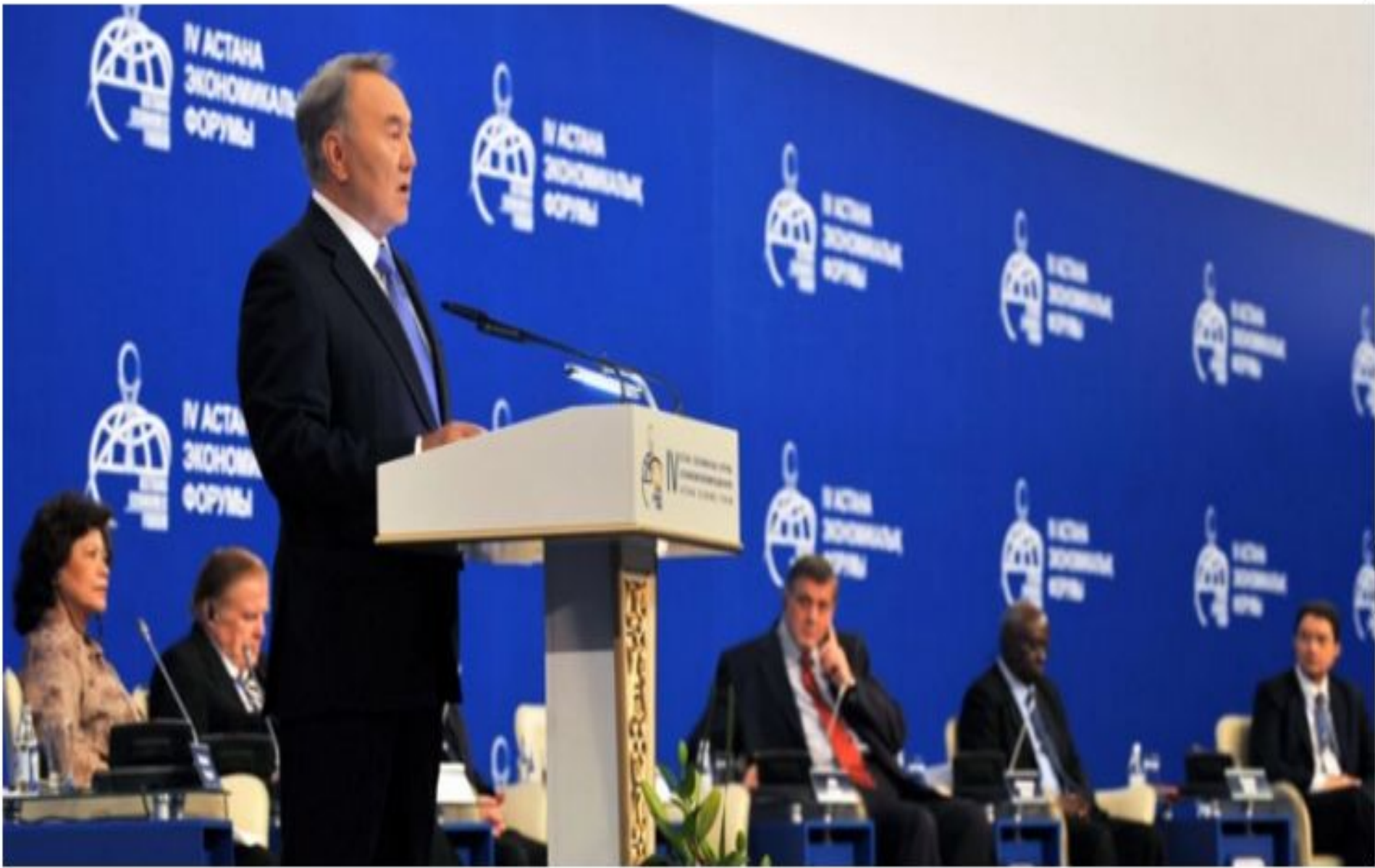
IV Астана экономикалық форумда сөз сөйлеп тұрған кезі, 2011 жылғы 3 мамыр.