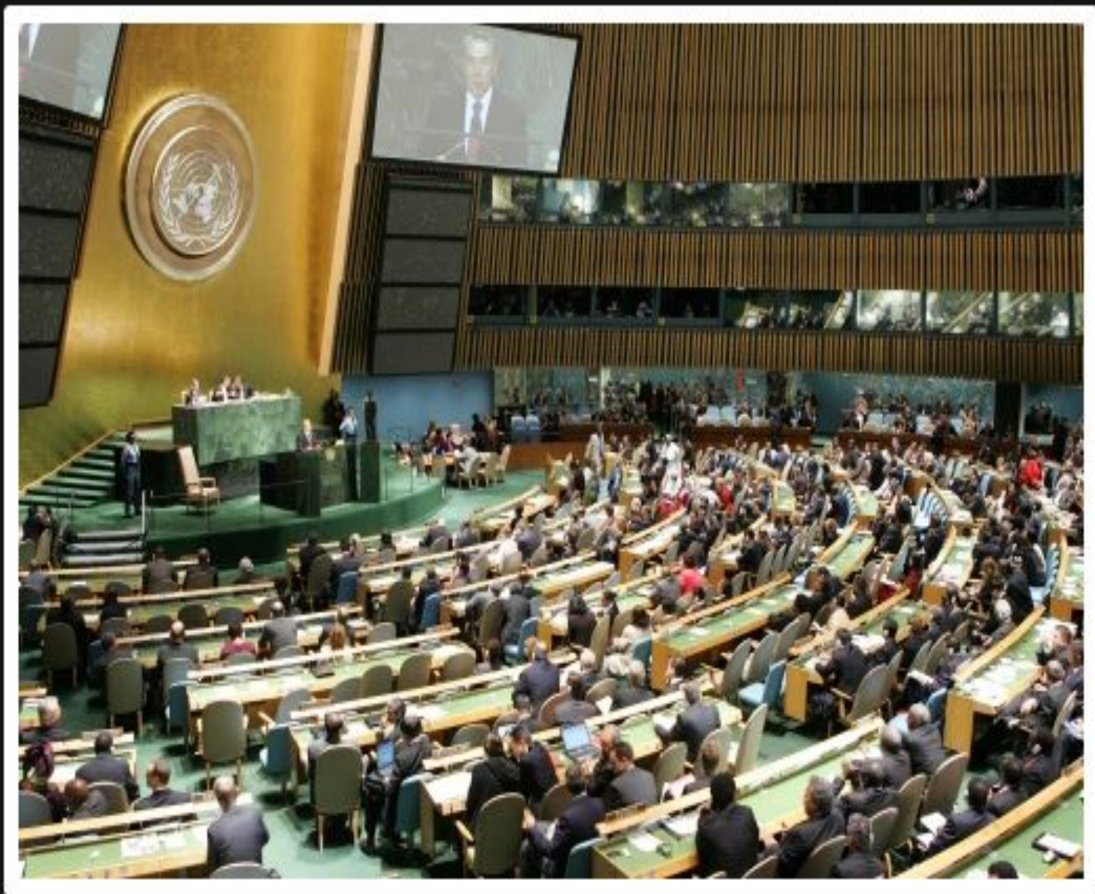
Нью-Йоркте БҰҰ Бас Ассамблеясының 62-ші сессиясы мінберінде, 2007 жылғы 25 қыркүйек