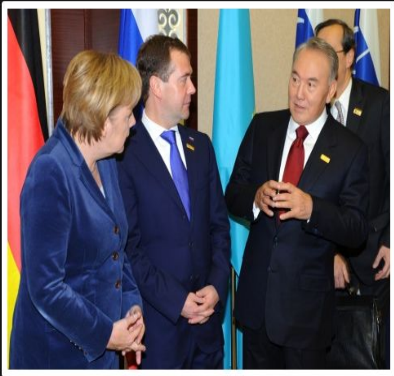
ЕҚЫҰ Астана саммиті аясында А.Меркельмен және Д.Медведевпен кездесуі, 2010 жылғы 30 қараша.