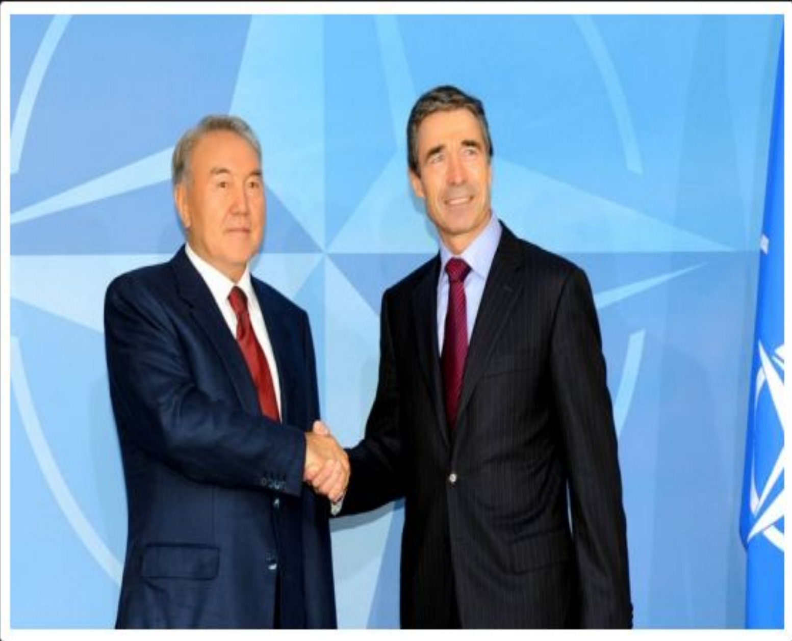
НАТО-ның Бас хатшысы Андерсон Фог Расмуссенмен кездесуі, Бельгия, 2010 жылғы 25 қазан.