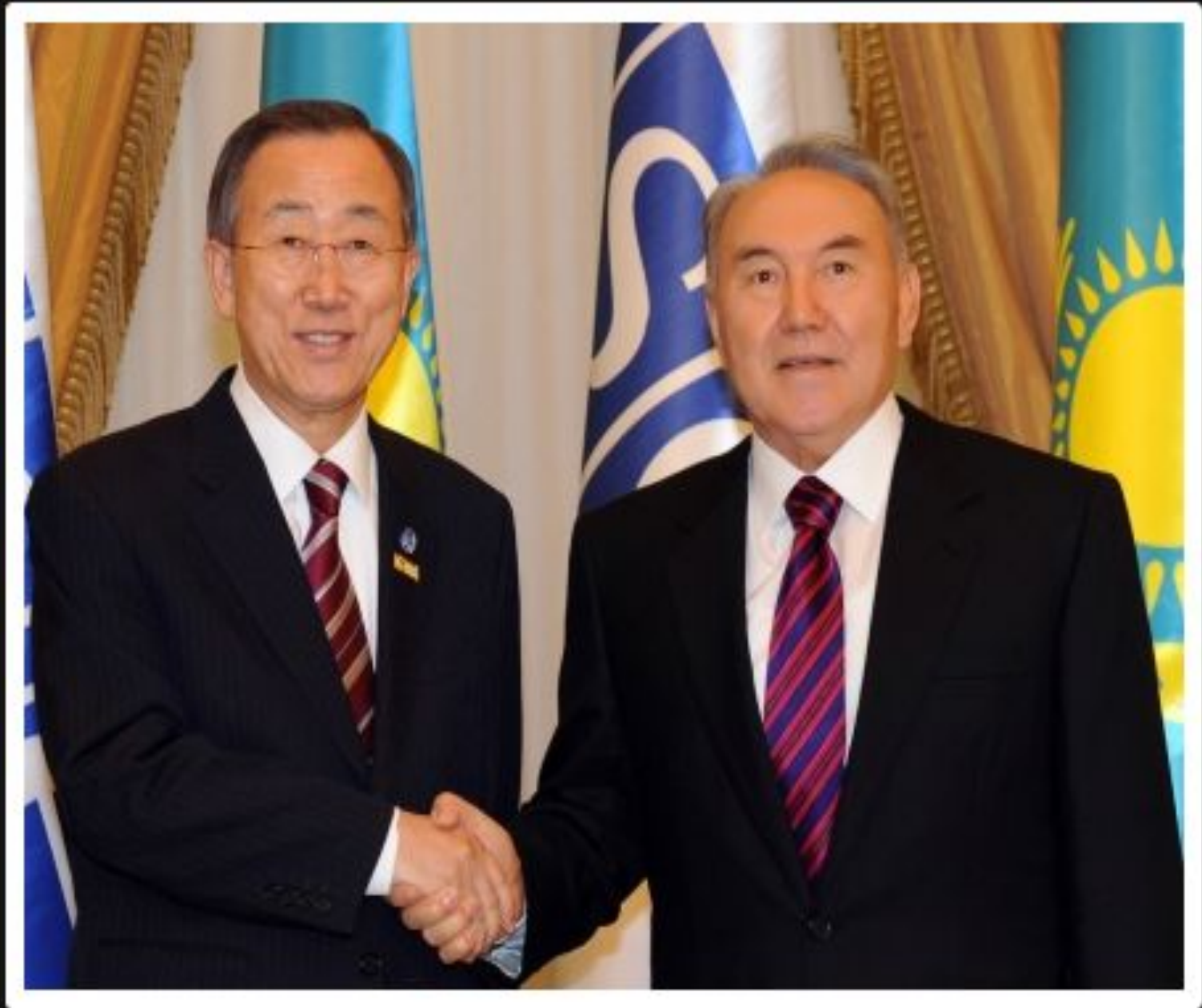
ЕҚЫҰ Астана саммиті аясында Пан Ги Мунмен кездесуі, 2010 жылғы 30 қараша.