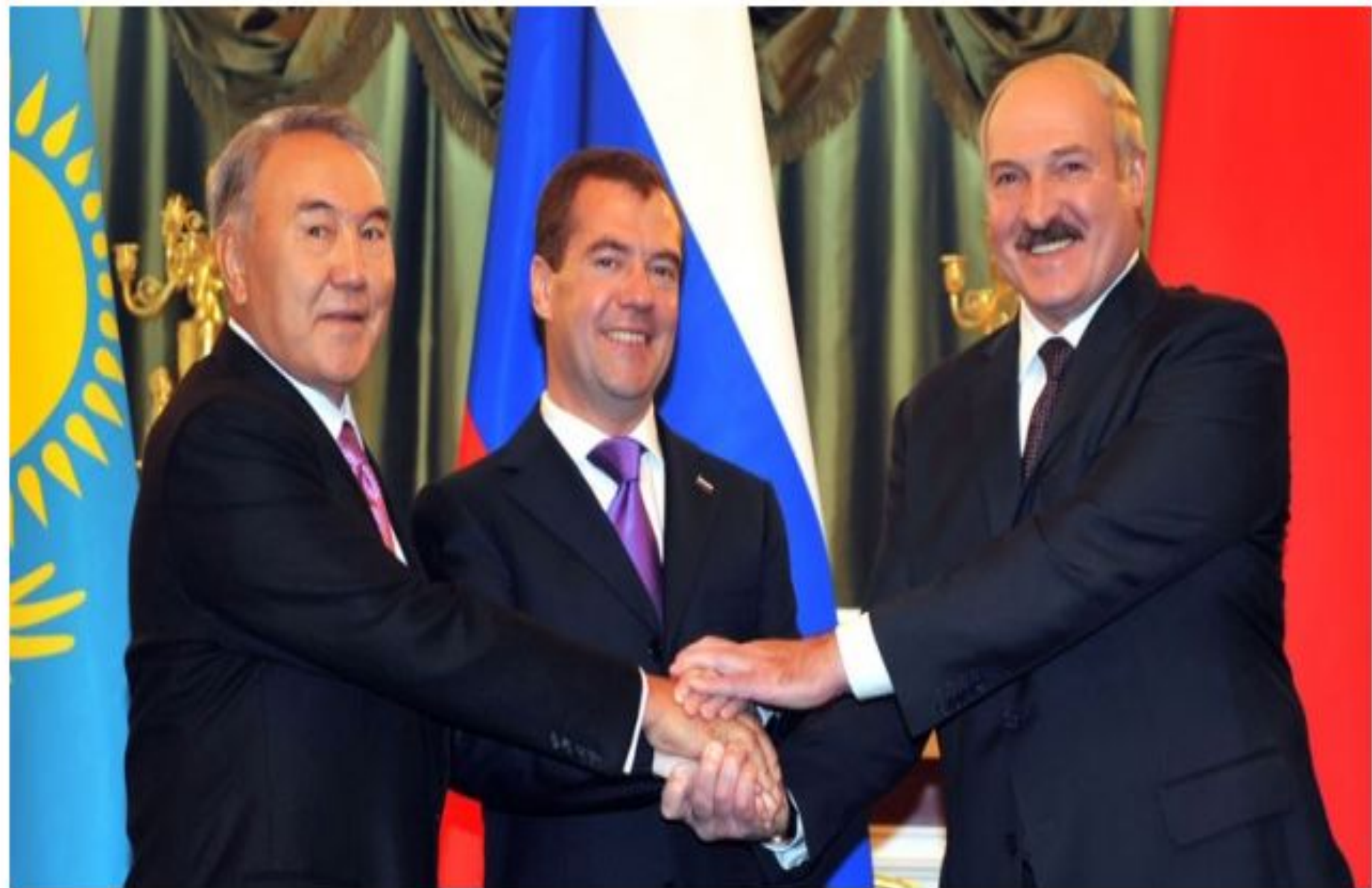
Еуразиялық үштіктің кездесуі, 2011 жылғы 18 қараша.