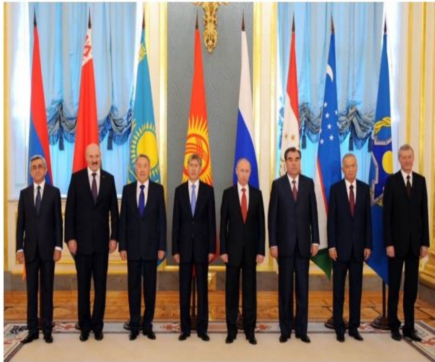
Мәскеуде өткен ҰҚШҰ саммиті, 2012 жылғы 15 мамыр.