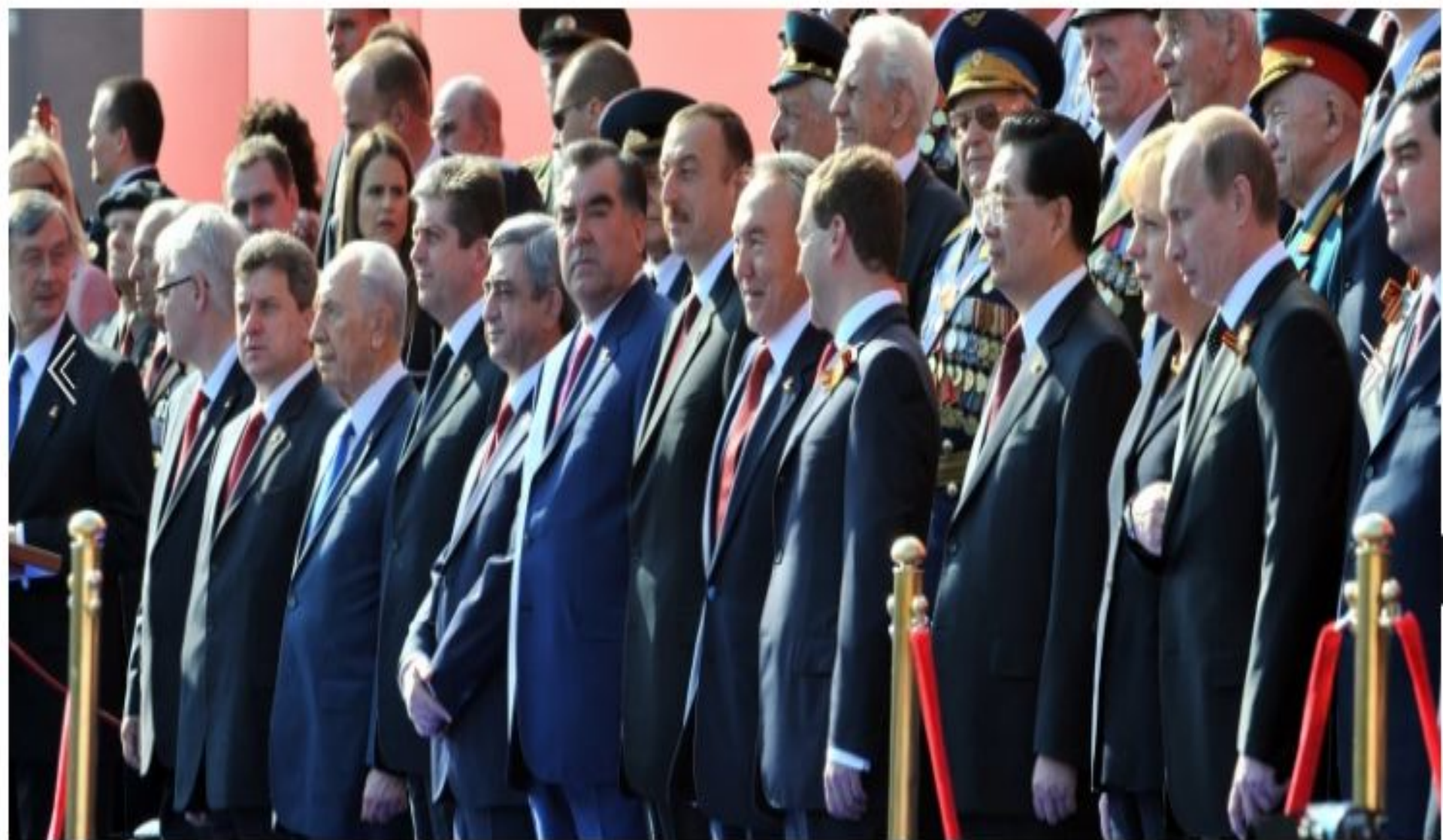
Мәскеудегі Жеңіс парады, 2010 жылғы 9 мамыр.