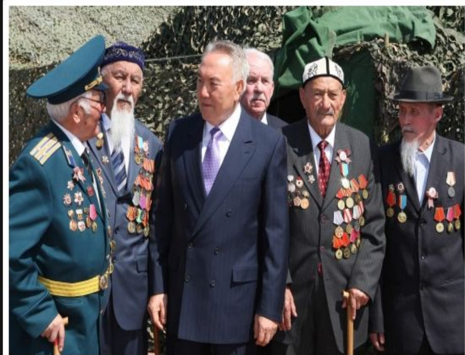
«Астана жұлдызы» ескерткішінің ашылуы, 2007 жылғы маусым