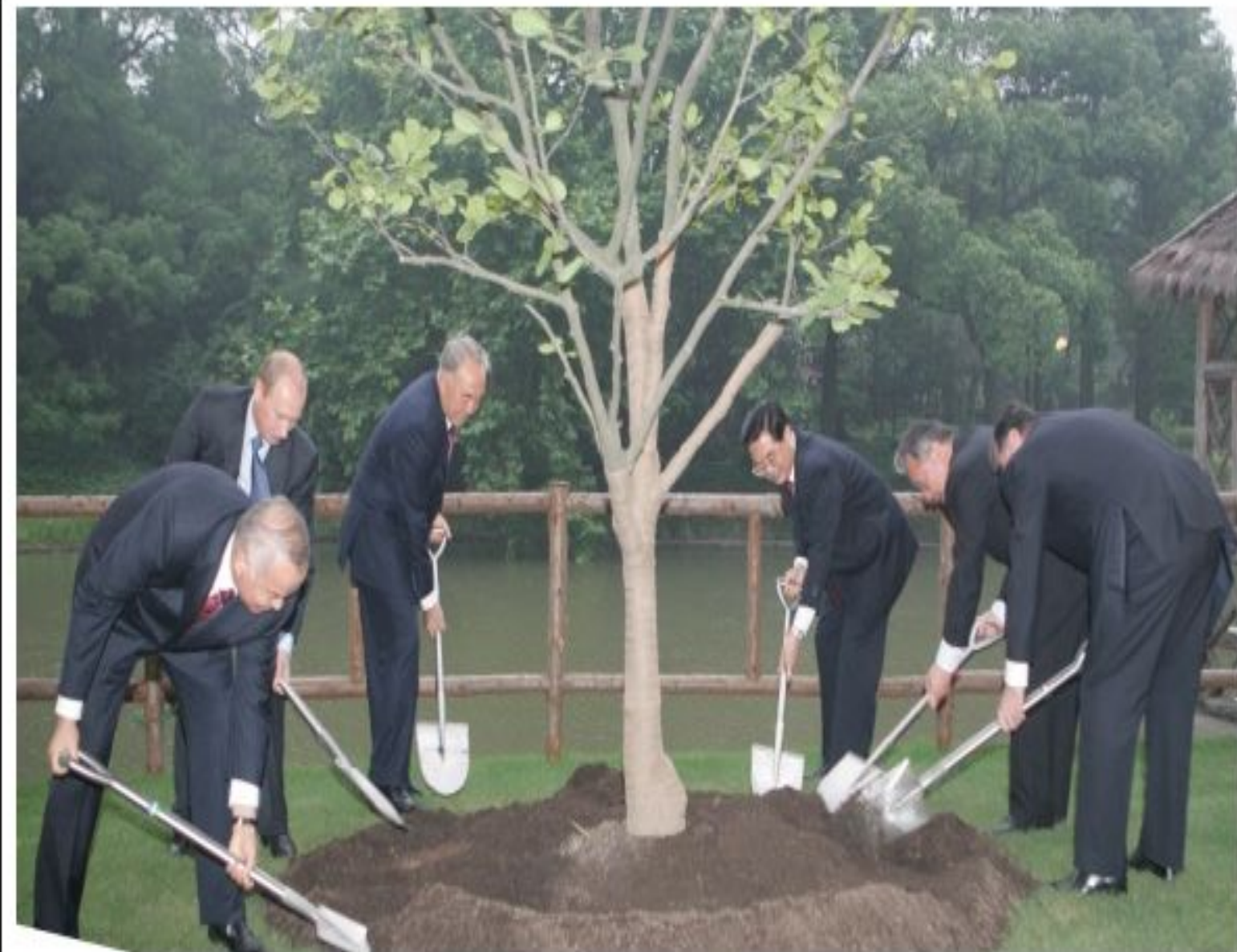
ШЫҰ саммиті, 2006 жылғы 14 маусым.