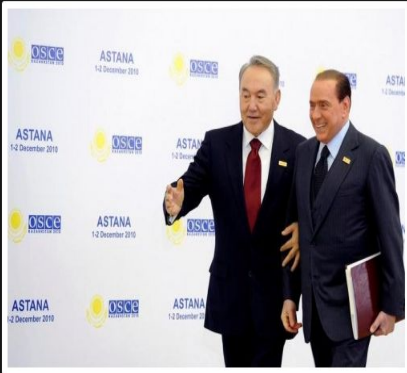
ЕҚЫҰ-ның Астанада өткен саммитінде С.Берлусконимен кездесуі, 2010 жылғы 1 желтоқсан.