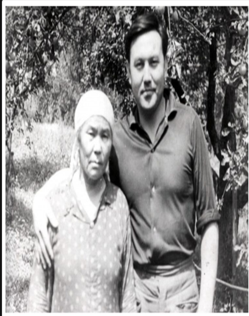
Анасымен туған үйдің ауласында