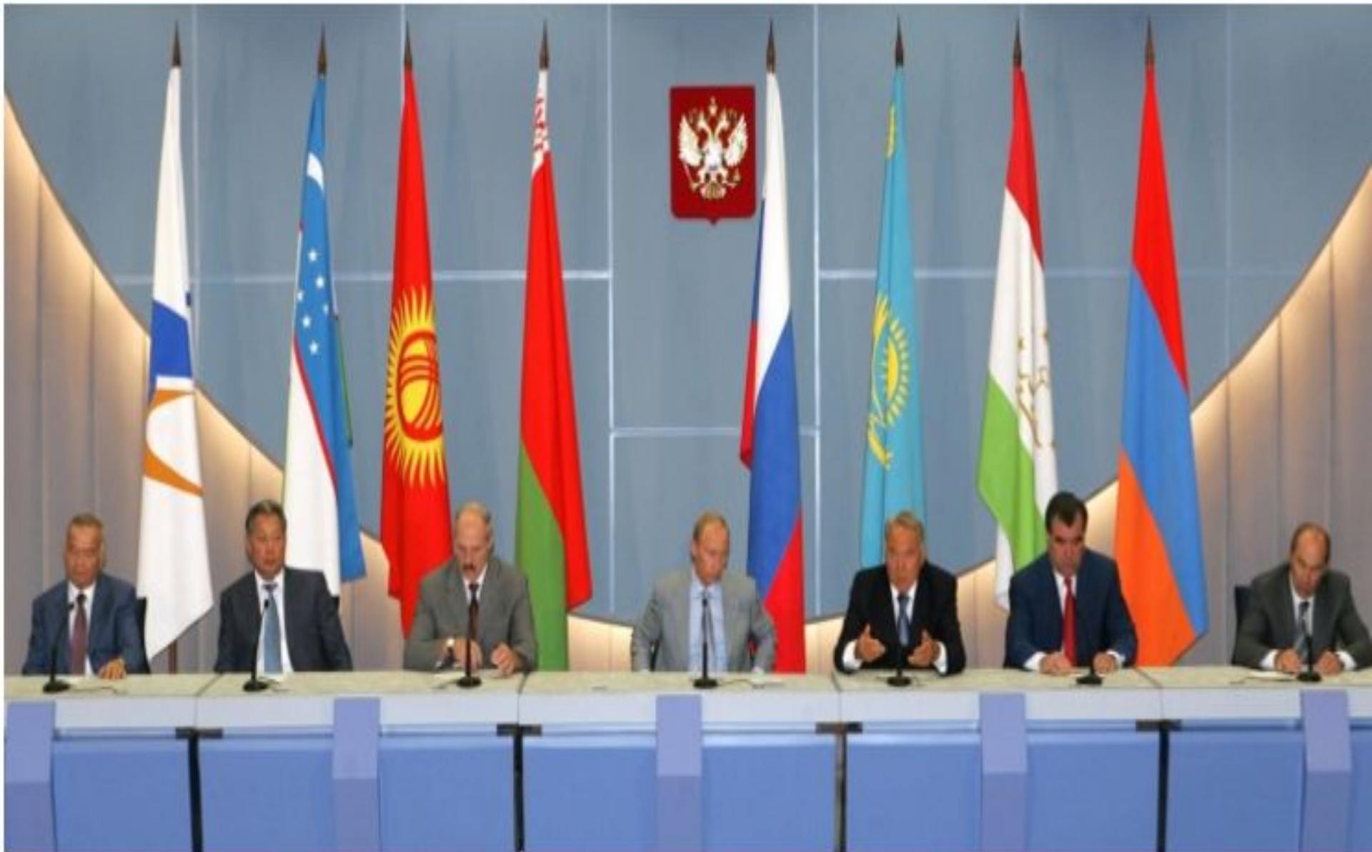
Социде өткен ЕурАзЭқ саммиті, 2006 жылғы 16 тамыз.