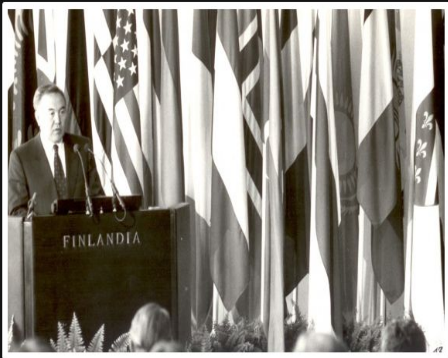
Еуропадағы қауіпсіздік және ынтымақтастық жөніндегі конференцияда сөз сөйлеп тұрған кезі, Хельсинк.