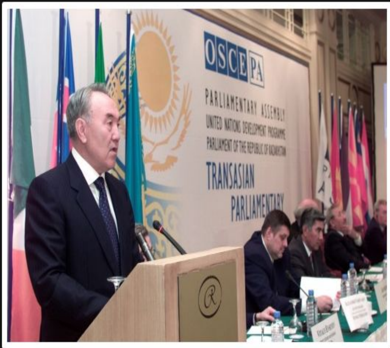
Алматыда өткен ЕҚЫҰ Парламенттік Ассамблеясы Трансазиялық форумда сөз сөйлеп тұрған кезі, 2003 ж...