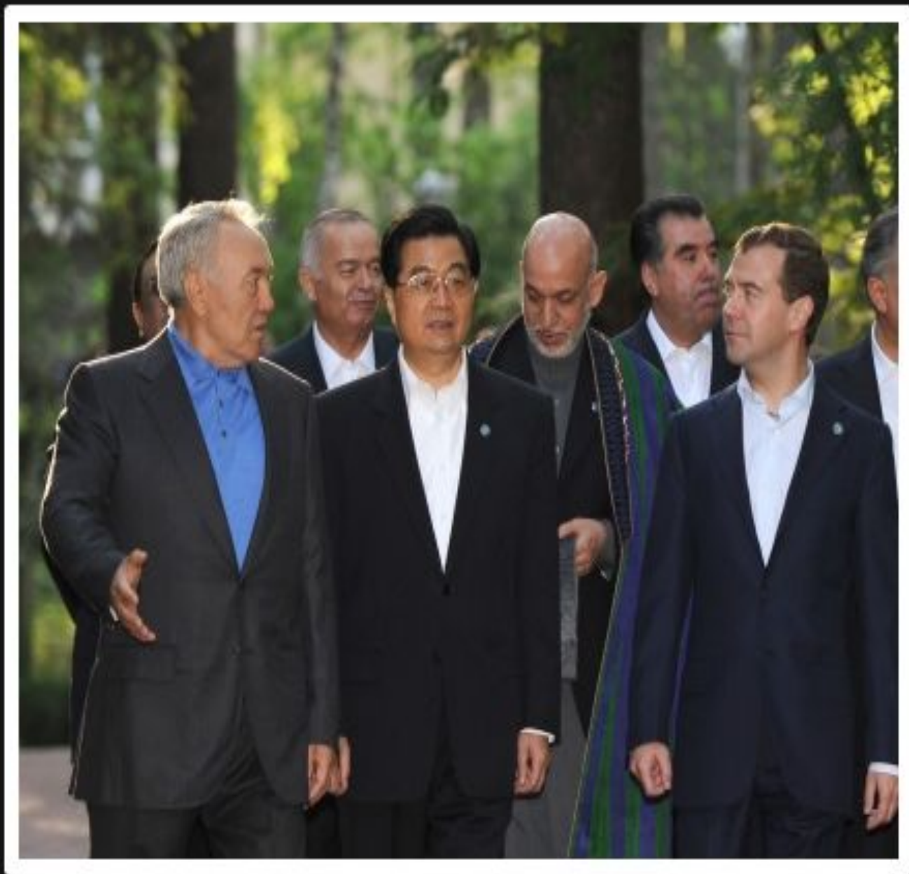
Екатеринбургте өткен ШЫҰ саммиті, 2009 жылғы 16 маусым.