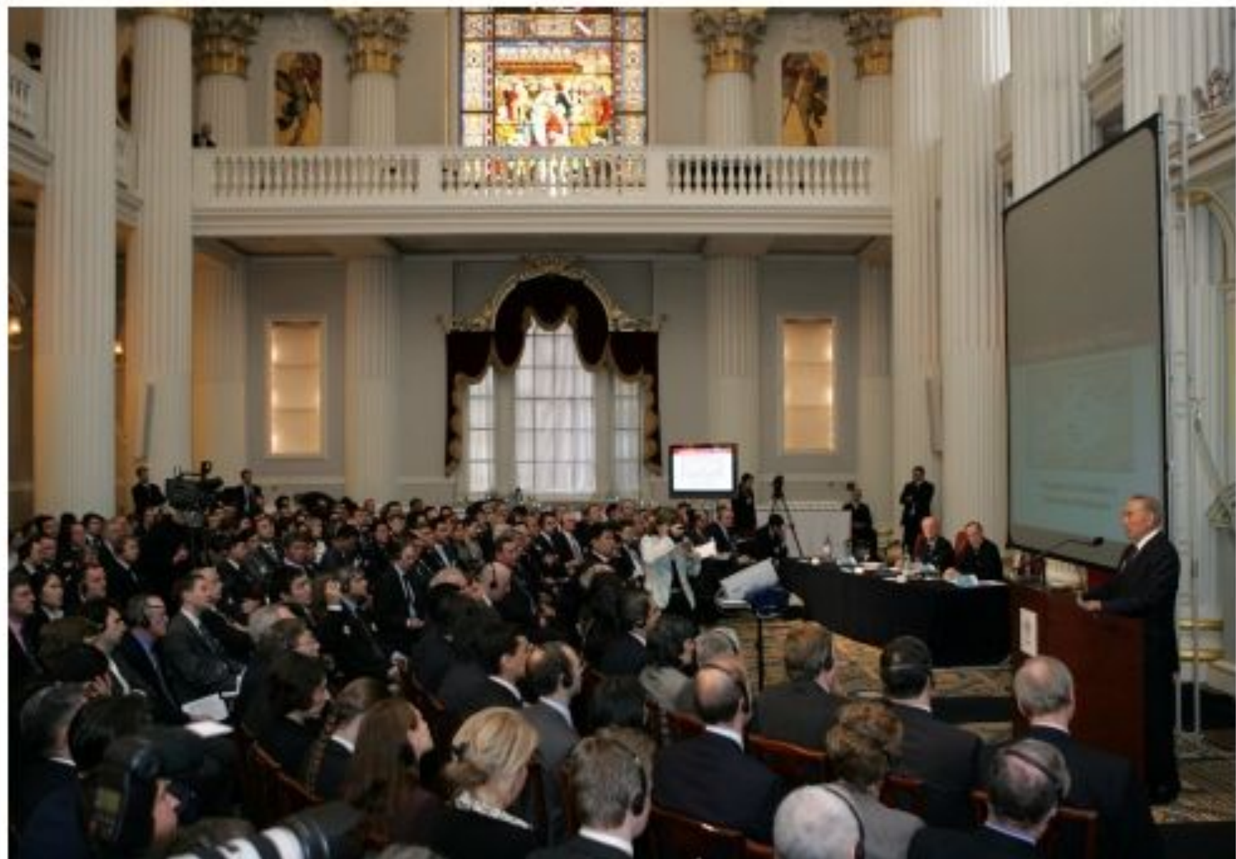
Лондонда өткен конференцияда сөз сөйлеген кезі, 2006 жылғы 22 қараша.