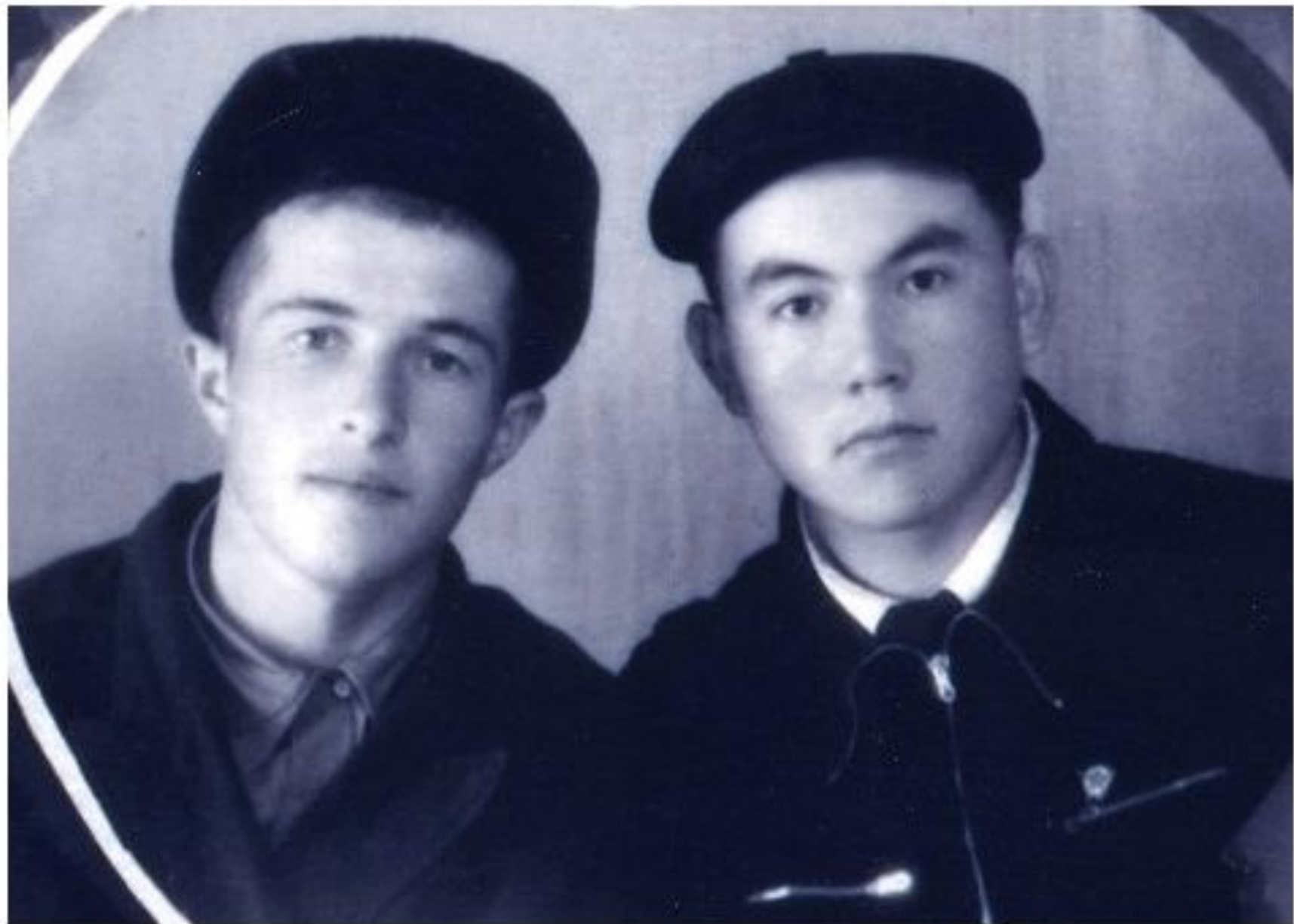
Н.Назарбаев досы Қ.Хаджиевпен