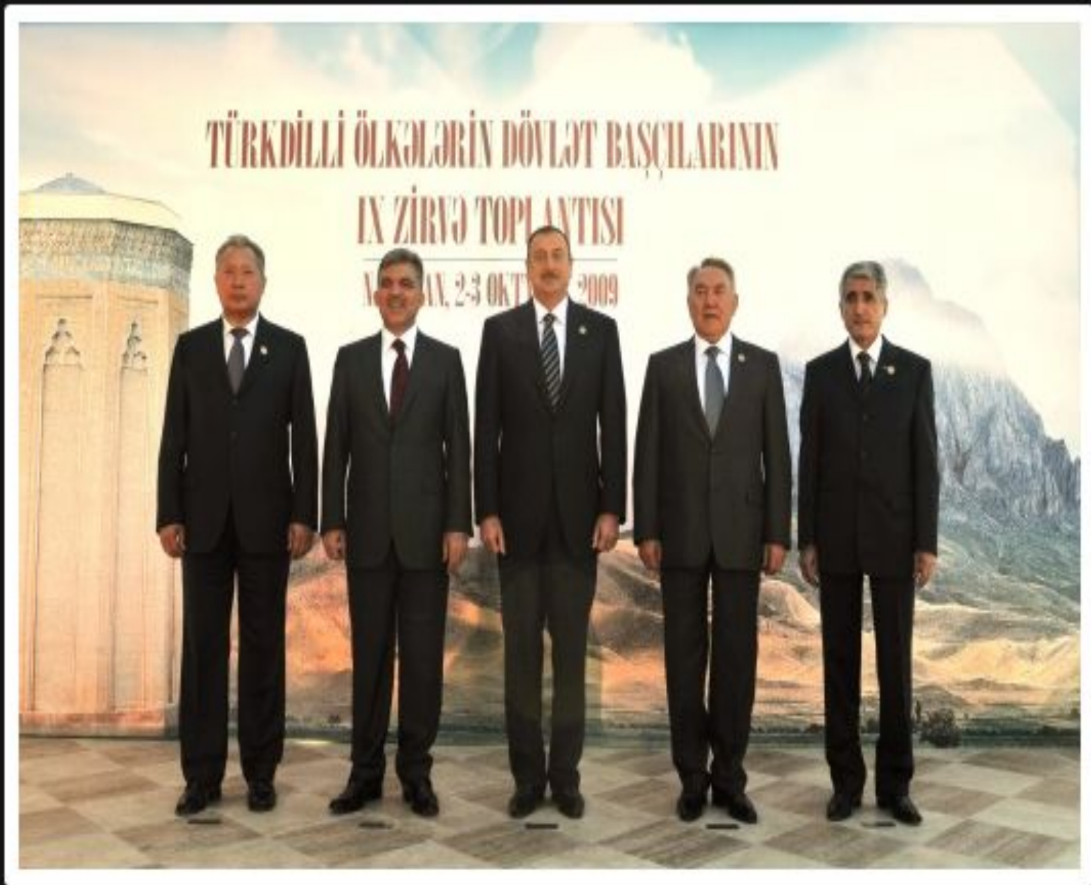
Әзербайжандағы Түркі тілдес мемлекеттер басшыларының саммиті, 2009 жылғы 3 қазан.