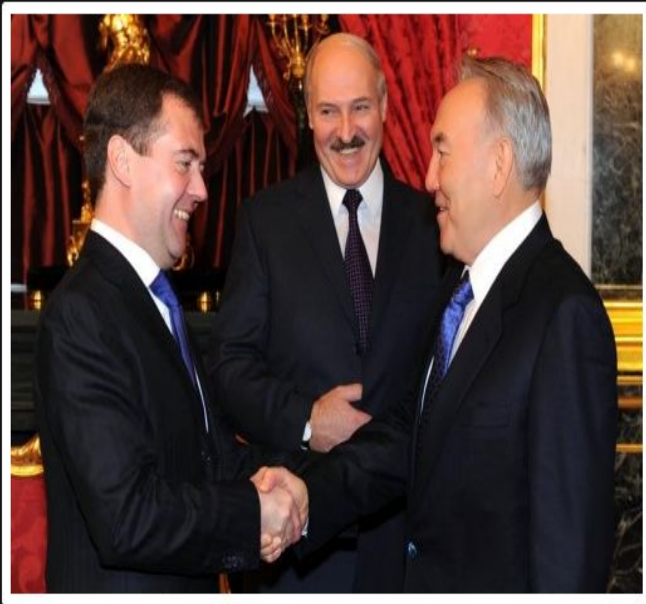
Біртұтас экономикалық кеңістік құру туралы декларация, 2011 жылғы 9 желтоқсан