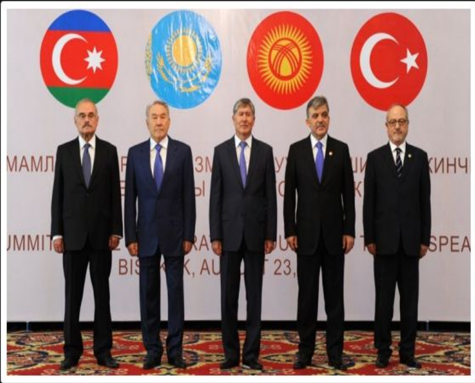
Второй саммит Совета сотрудничества тюркоязычных государств, 23 августа 2012 г.