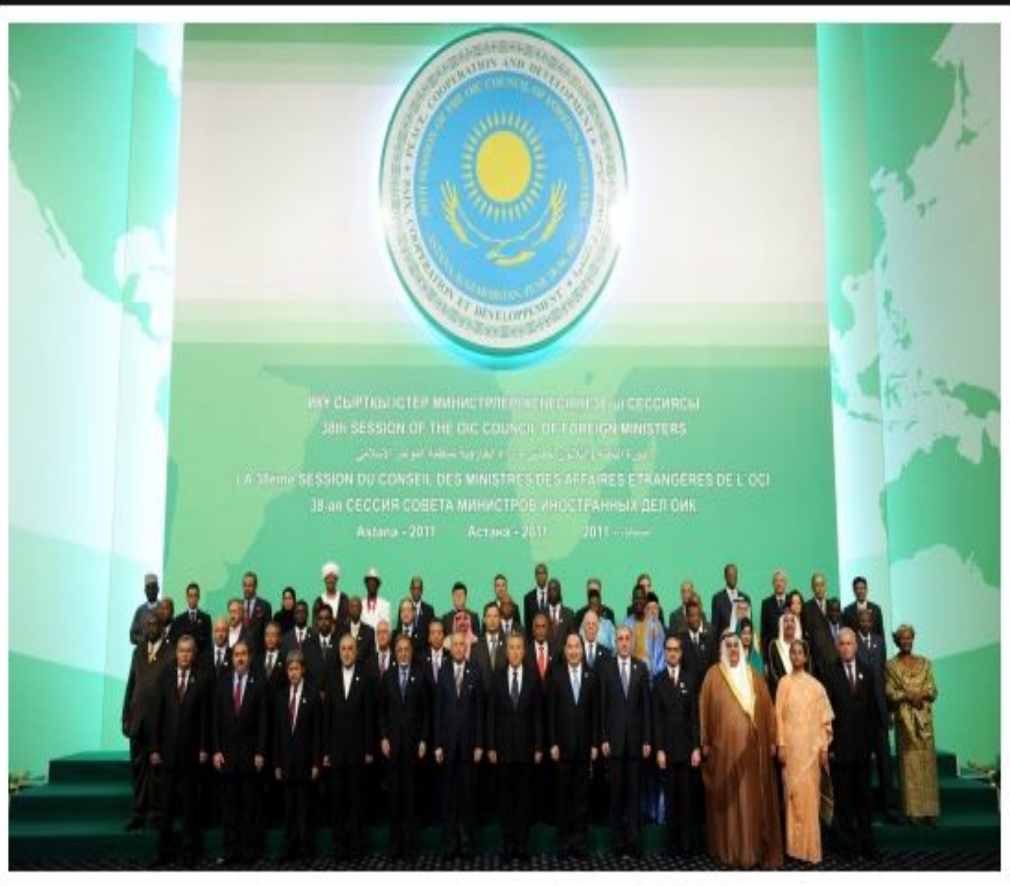
Астанада өткен Ислам ынтымақтастық ұйымының Сыртқы істер министрлері кеңесінің 38-сессиясы, 2011.