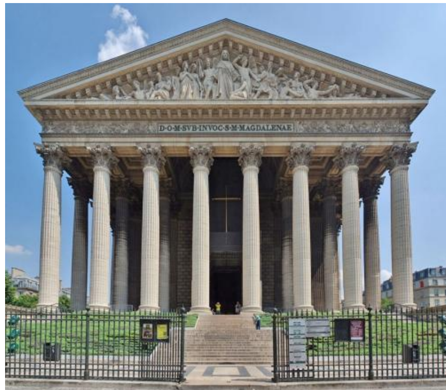
3. церковь Сен-Мадлен Париж