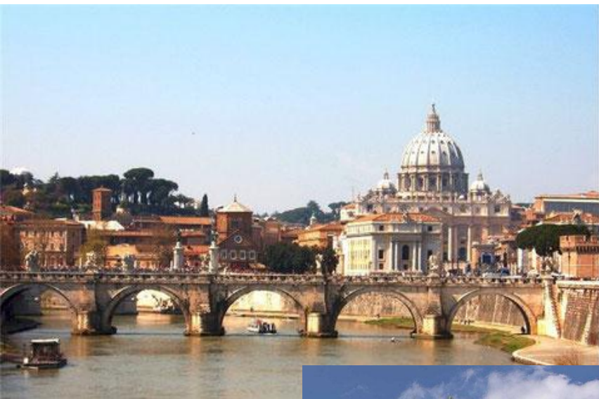
1. Собор св. Петра в Риме.