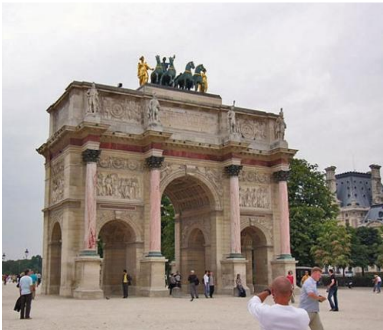
4. Триумфальная арка на площади Карузель. Париж