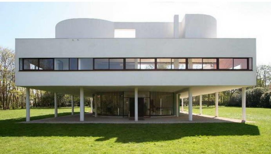
3. Вилла Савой в Пуасси, арх. Ле Корбюзье, 1930 Лондоне