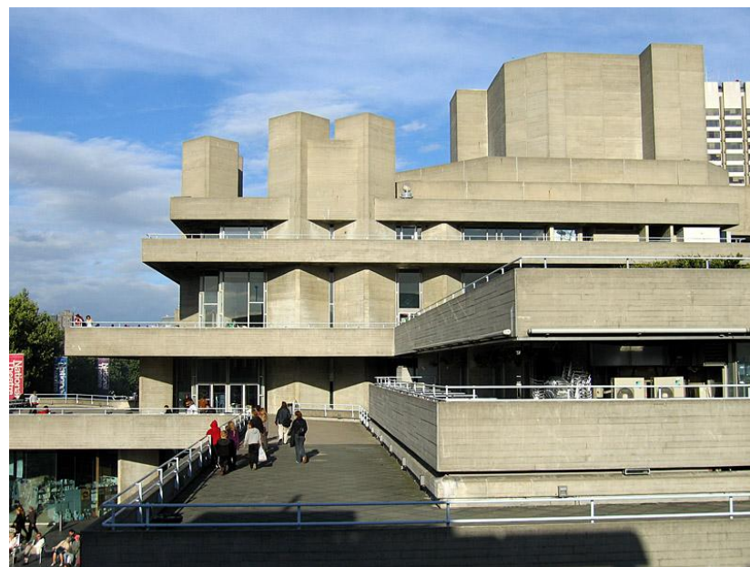
4. Королевский Национальный театр в