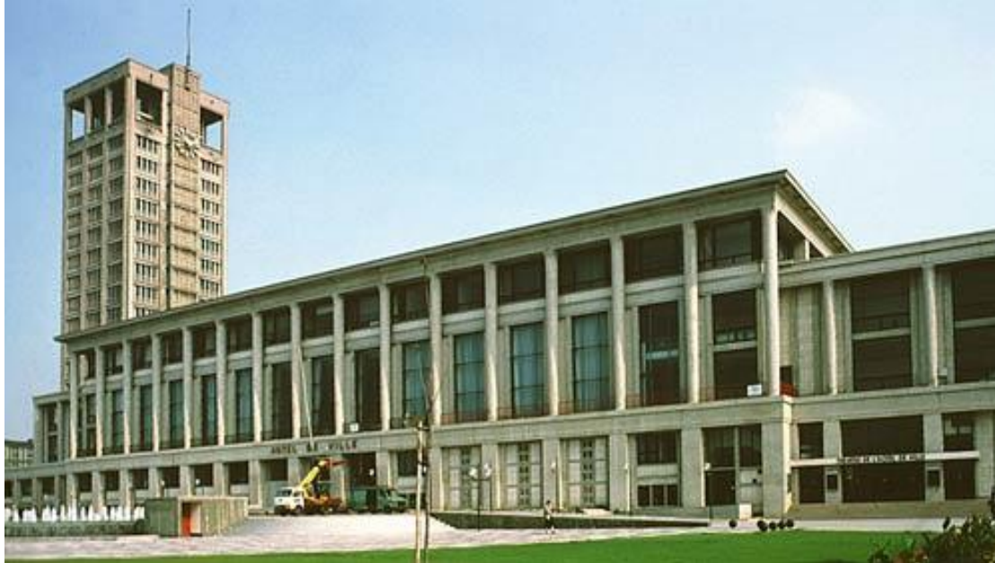
2. Здание в центре Гавра