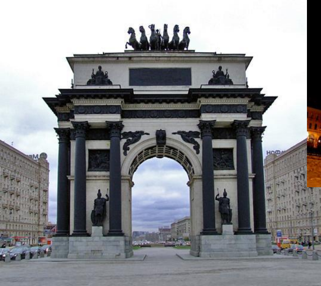
1. Триумфальные ворота в Москве