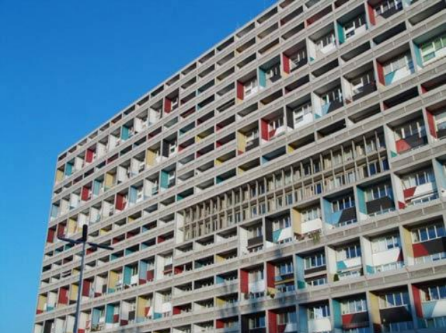
1. Здание в районе Ганза Архитектор Ле Корбюзье