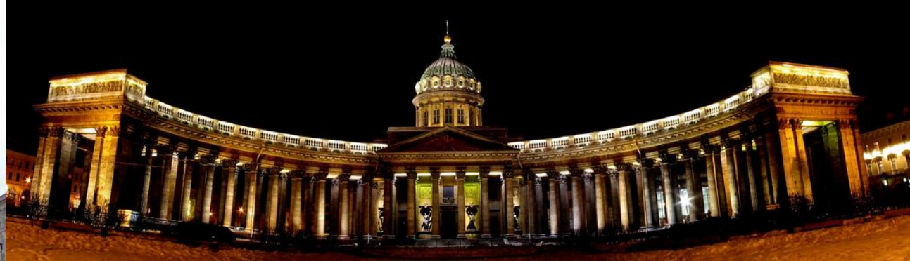
2. Казанский собор (Санкт-Петербург)