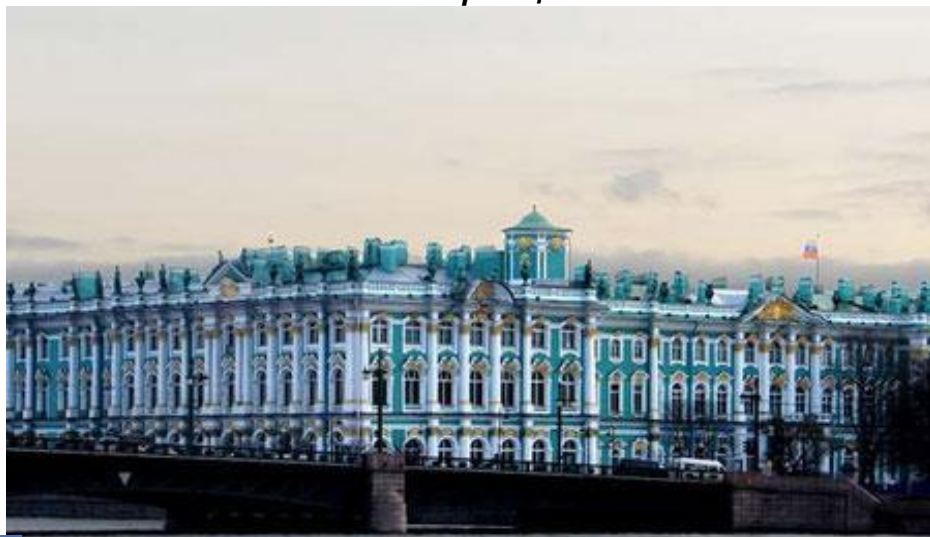
2. Зимний дворец в Санкт-