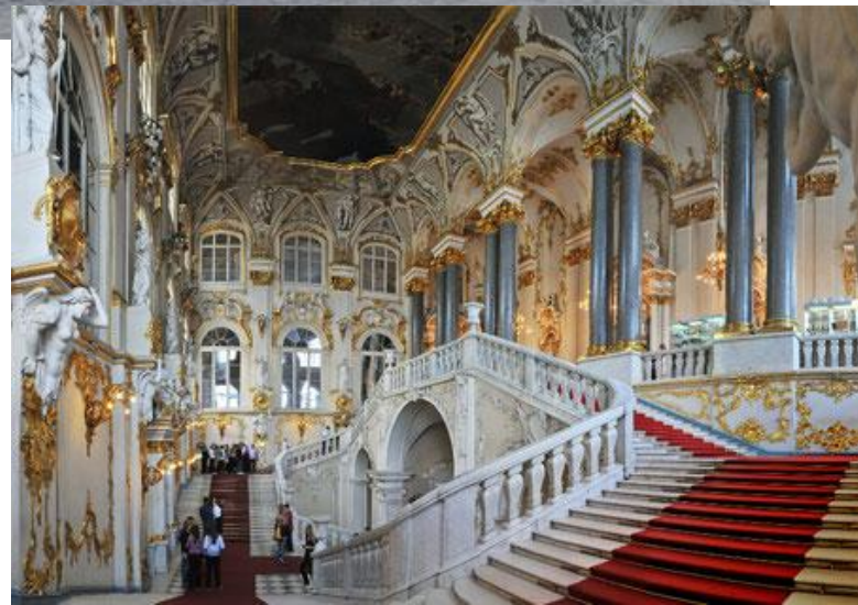
3. Парадная лестница в Зимнем