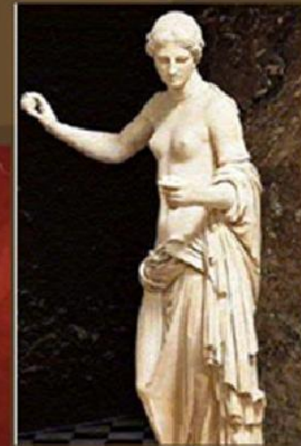
■ Афродита, греческая богиня любви