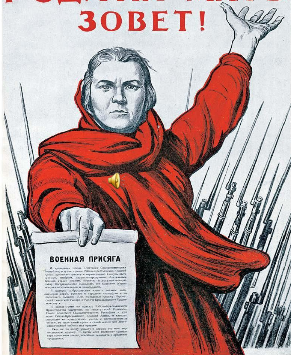
Плакат «Родина-мать зовет!» Художник И.М. Тоидзе. 1941 г.