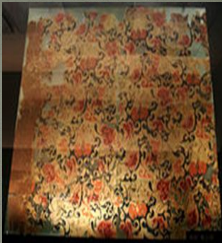
Образцы шелка династии Хань