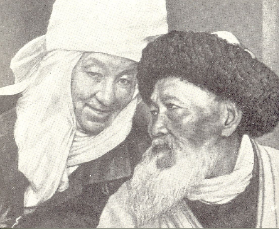
Жамбыл және Дина Нұрпейісова

Атақты совет режиссері С.М. Эйзенштейн Жамбылдың үйінде қонақта