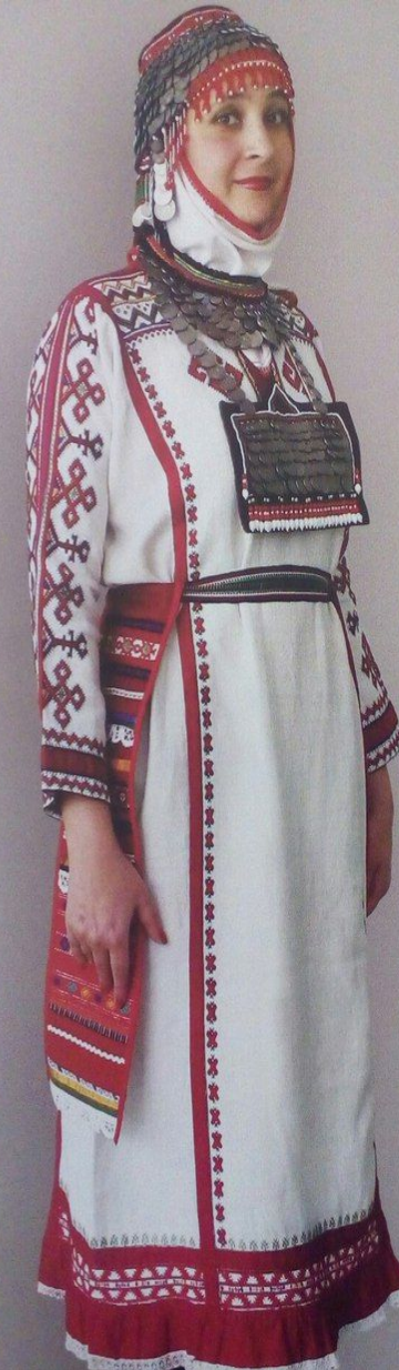
Женский костюм в традициях средне-низовых чувашей. 1988 г.

Женский костюм в традициях средне-низовых чувашей 1988 г. (хушпк, сурпан, рубаха, пояс, яркӑч, нашейные украшения, холст, мулине, вышивка, ситец, кружева, нашивки)