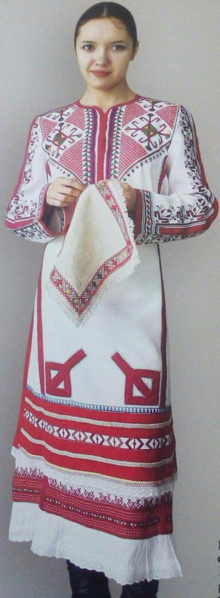
Костюм в традициях самарских чувашей. 1984 г. Платье, передник.

Костюм в традициях самарских чувашей 1984 г. (платье, передник, холст, редина, мулине, вышивка, нашивки, кружева)