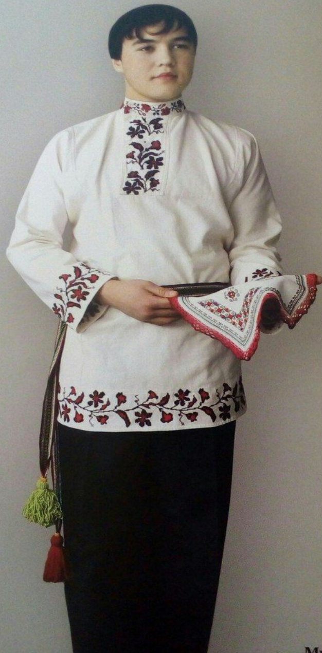
Мужская рубашка 1989 г. (холст, мулине, вышивка)

Костюм в традициях самарских чувашей 1984 г. (платье, передник, холст, редина, мулине, вышивка, нашивки, кружева)