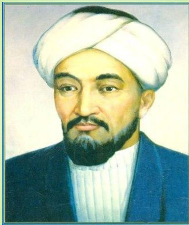
Әбу Насыр әл – Фараби 870 - 950