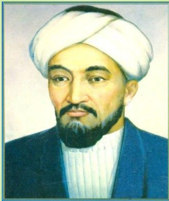
Әбу Насыр әл – Фараби 870 - 950