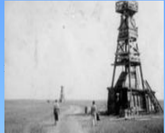
Вышка на Сарбайском карьере, 1959 г

Лотарингское, на базе которого работала почти вся черная металлургия Западной Европы, и в полтора раза больше всех обнаруженных запасов железных руд в США! И это были размеры только разведанных запасов, но у геологов есть еще и такой термин перспективные запасы. А знаете ли вы, какой фантастической цифрой обозначили геологи такие перспективы Большого Тургая? 25 миллиардов тонн!