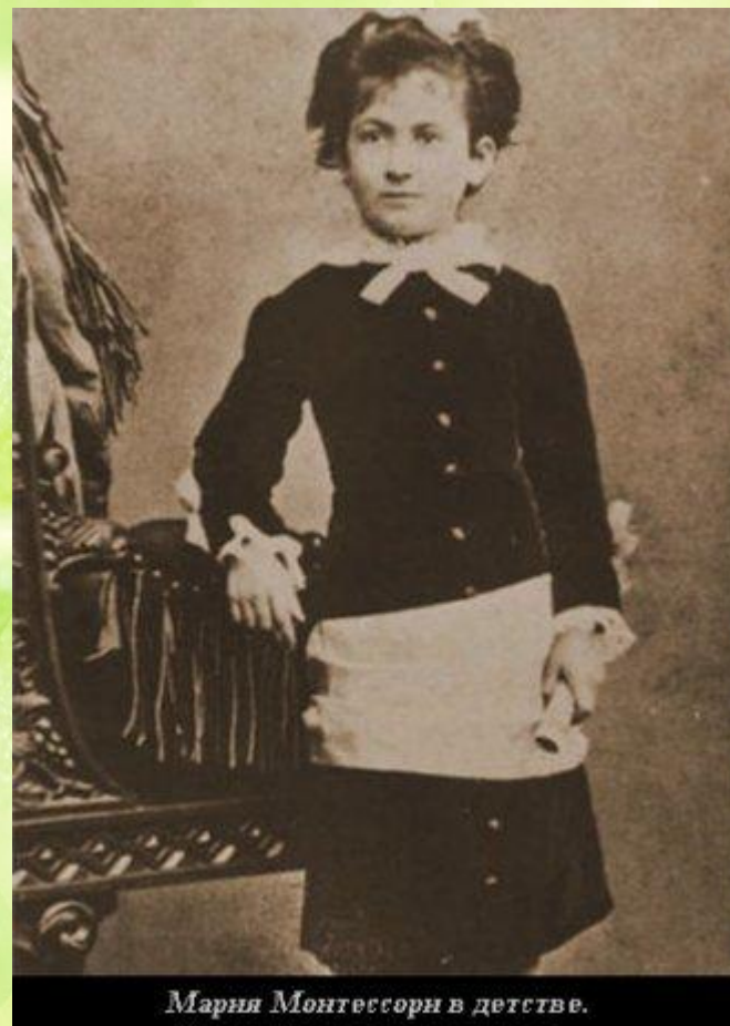
Мария Монтессори в детстве.