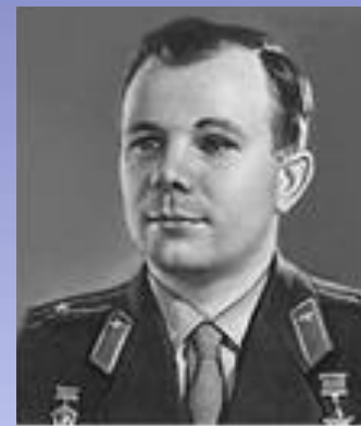
Ю. А. Гагарин

❖ Кто из вышеуказанных лиц перед началом очень ответственного задания сказал: "Поехали!"