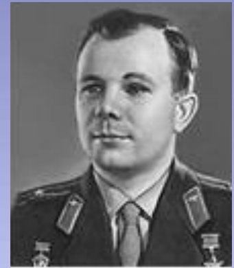
Ю. А. Гагарин

❖ Кто из вышеуказанных лиц перед началом очень ответственного задания сказал: "Поехали!"