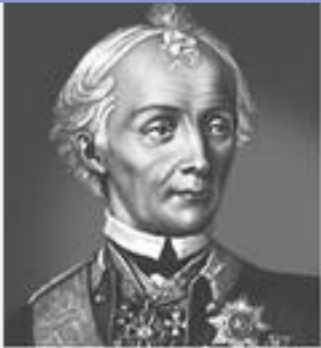
А. В. Суворов