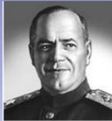
Г. К. Жуков