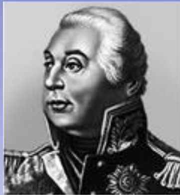
М. И. Кутузов