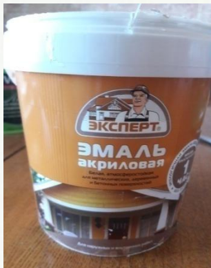
Белая акриловая краска