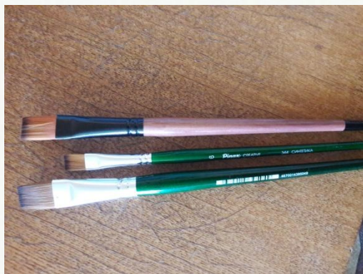
Кисти синтетические разных размеров