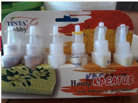
Набор для кракелюра