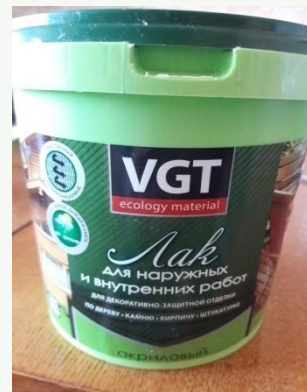
Глянцевый акриловый лак