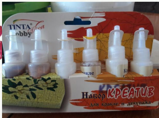
Набор для кракелюра