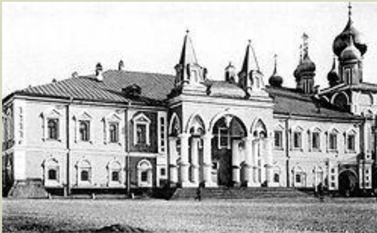
Чудов монастырь в XX веке