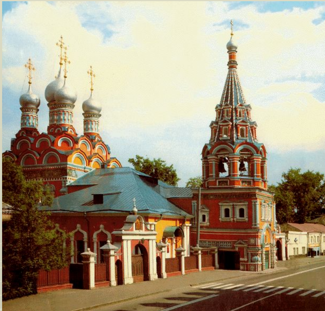
Храм Григория Неокесарийского В Дербицах