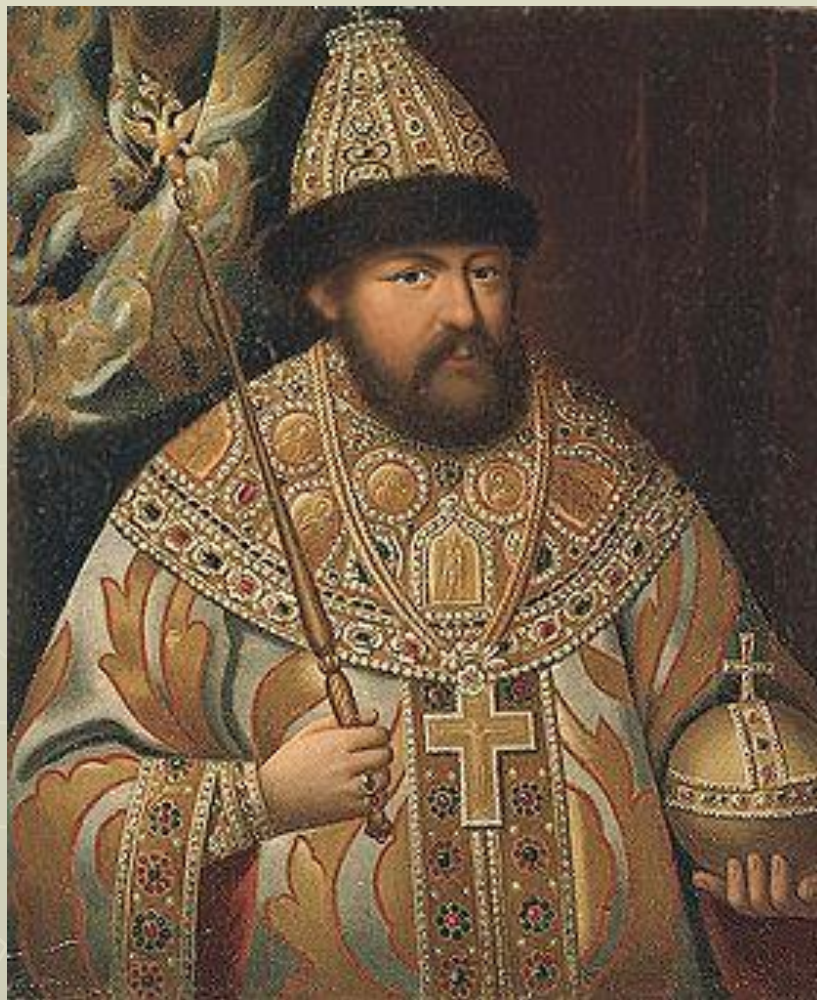
Портрет Алексея Михайловича Романова