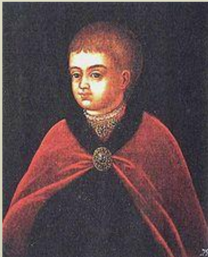
Петр I. Парсуна XVII век