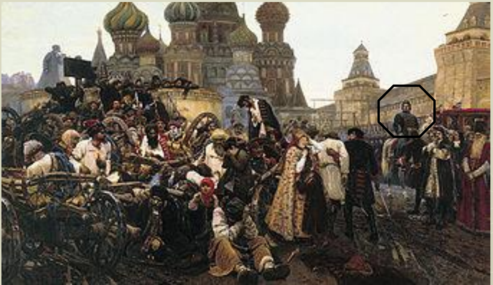
Утро стрелецкой казни. Художник В.И. Суриков 1881 год