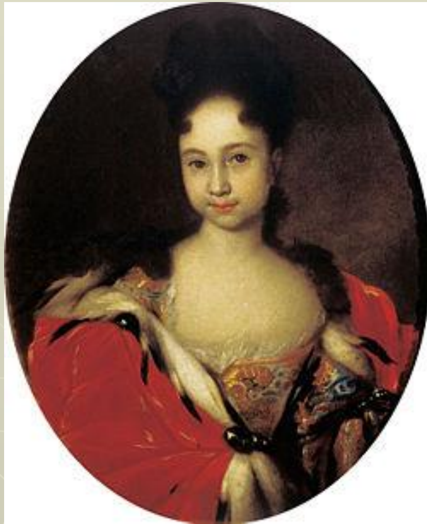
Портрет Анна Петровна работы Никитина