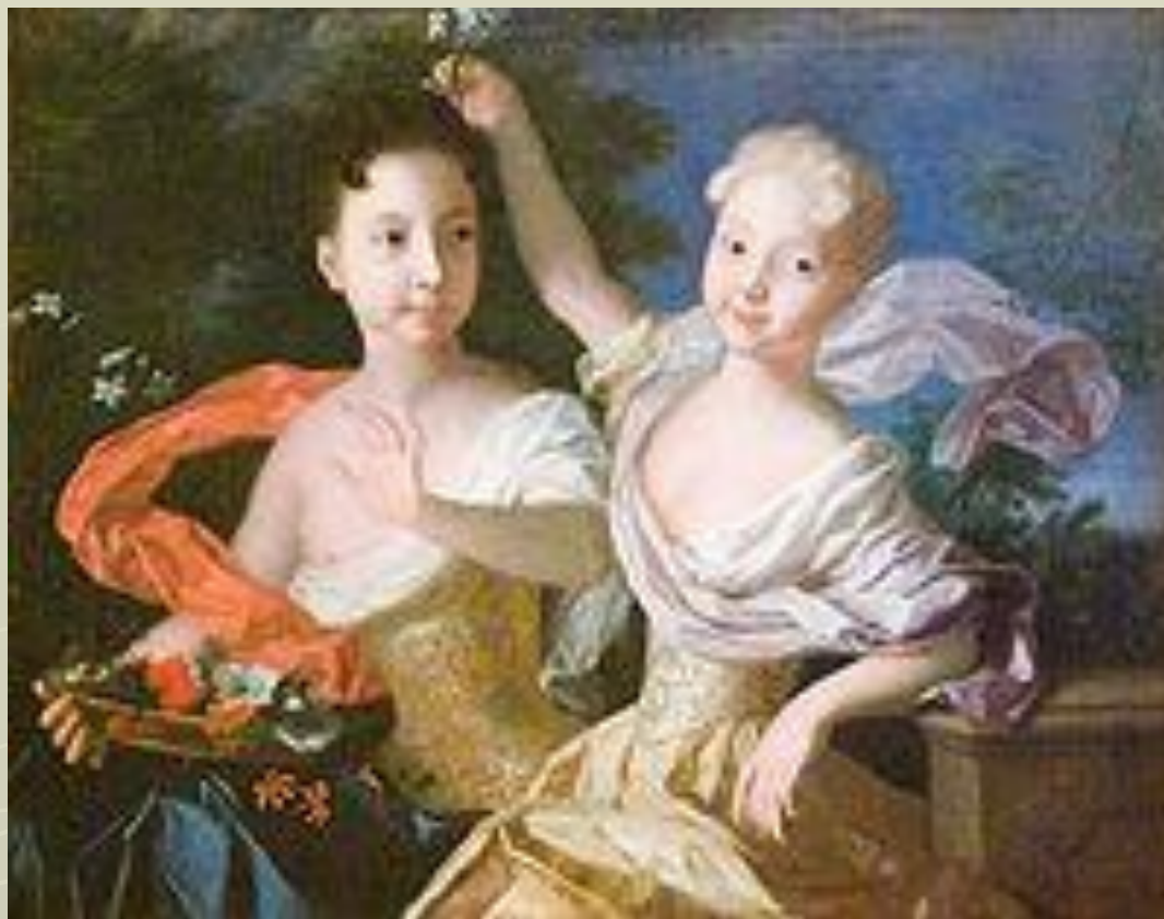
Портрет цесаревен Анны Петровны и Елизаветы Петровны. Луи Каравак 1717 год