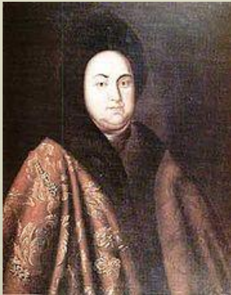
Евдокия Федоровна Лопухина. Неизвестный художник XVIII век