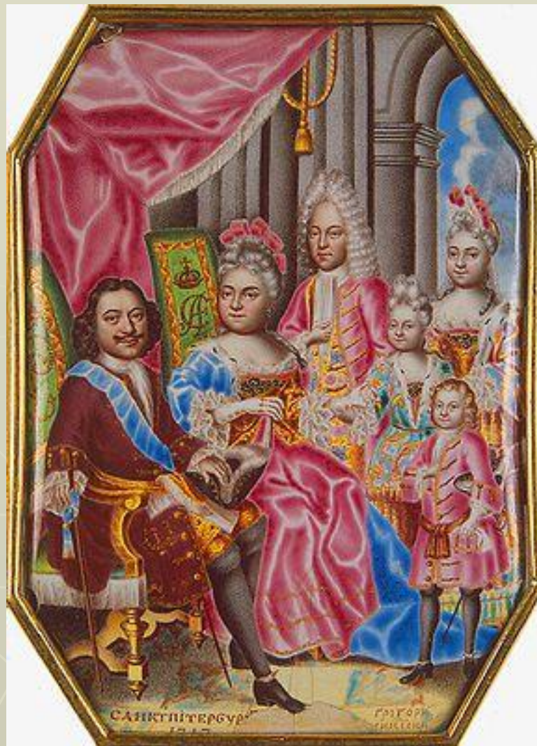
Семья Петра I в 1717 году. Эмаль на медной пластинке