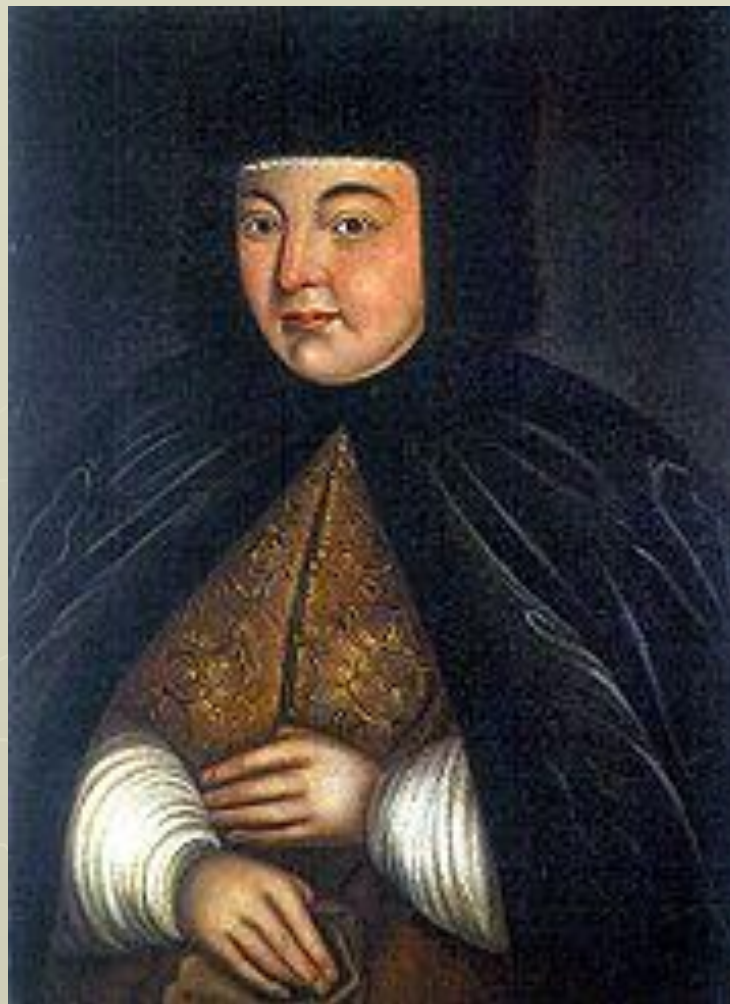
Наталья Кирилловна Нарышкина