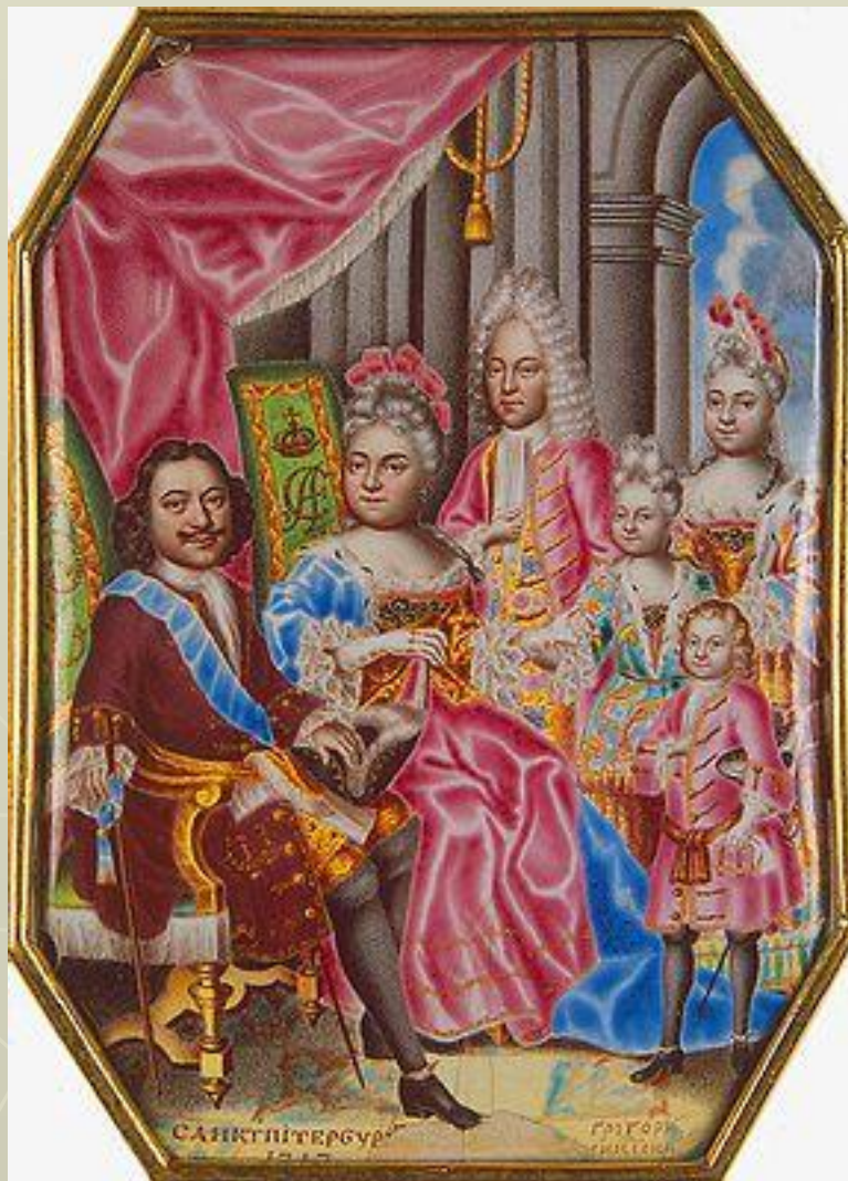
Семья Петра I в 1717 году. Эмаль на медной пластинке