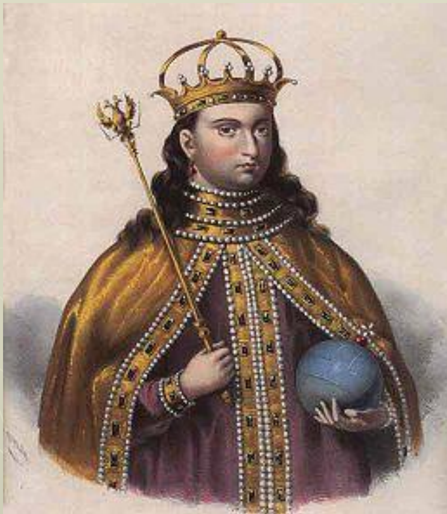
Царевна Софья Алексеевна