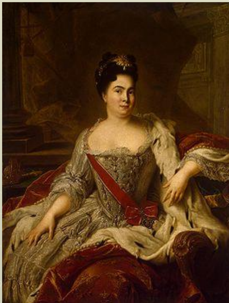
Портрет Екатерины I. Натъе 1717 год