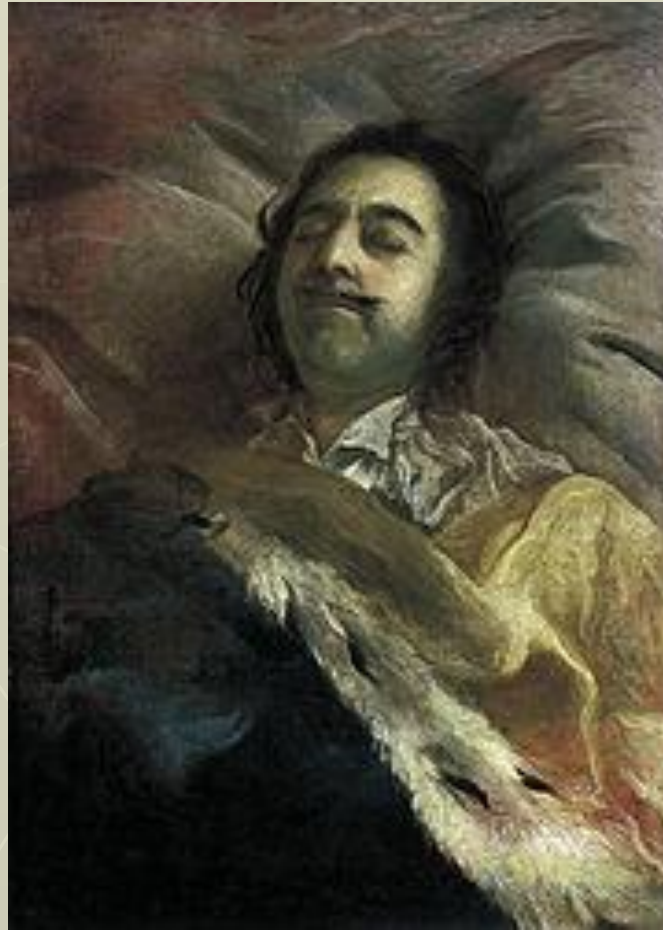
И.Н. Никитин «Петр I на смертном одре»