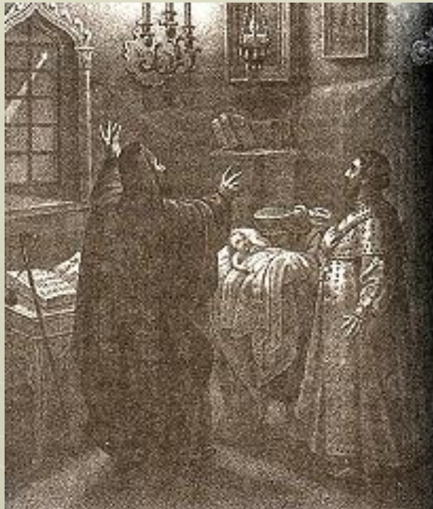
Гравюра «Рождение Петра»