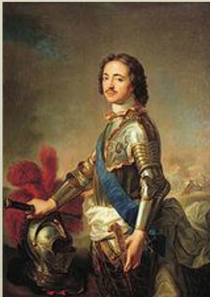
Петр I. Натье 1717 год.