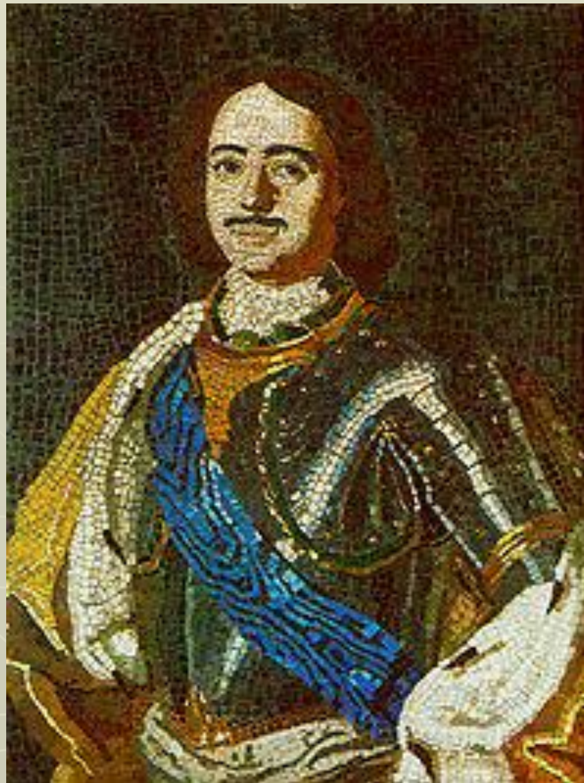
Петр I. Мозаика. Набрана М.В. Ломоносовым в 1754 году.