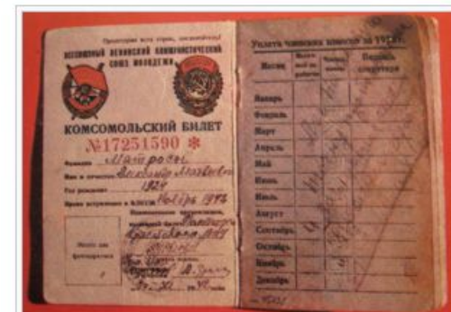
Комсомольский билет № 17251590. Надпись: □ «Лег на боевую точку противника и заглушил её. Проявил героизм».