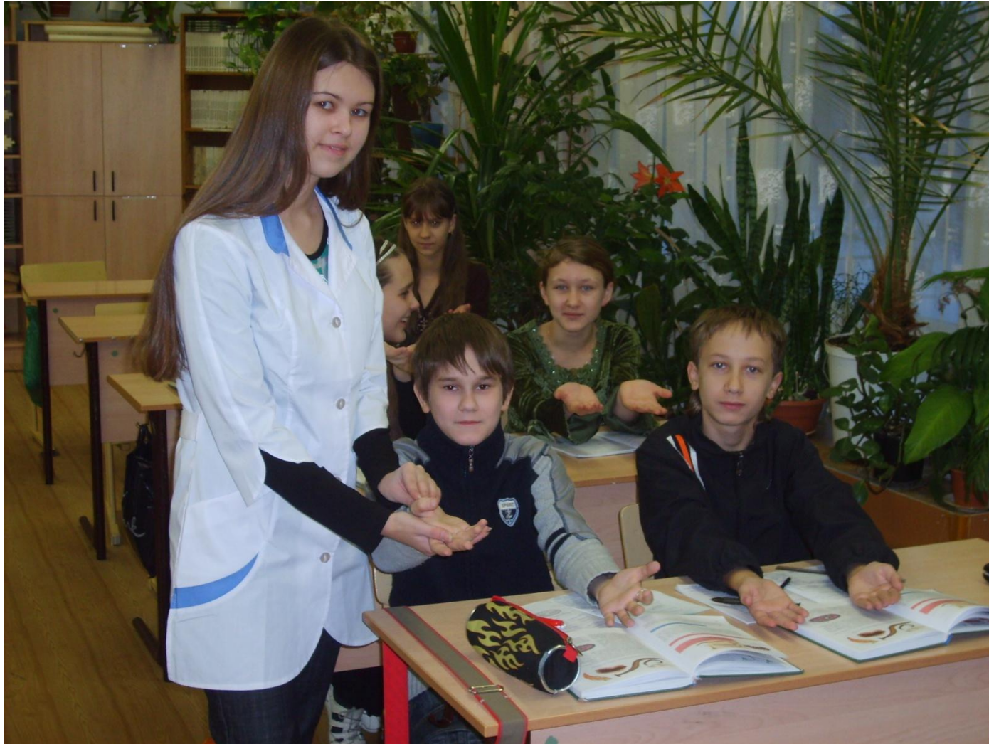
Урок гигиены в 7А классе.