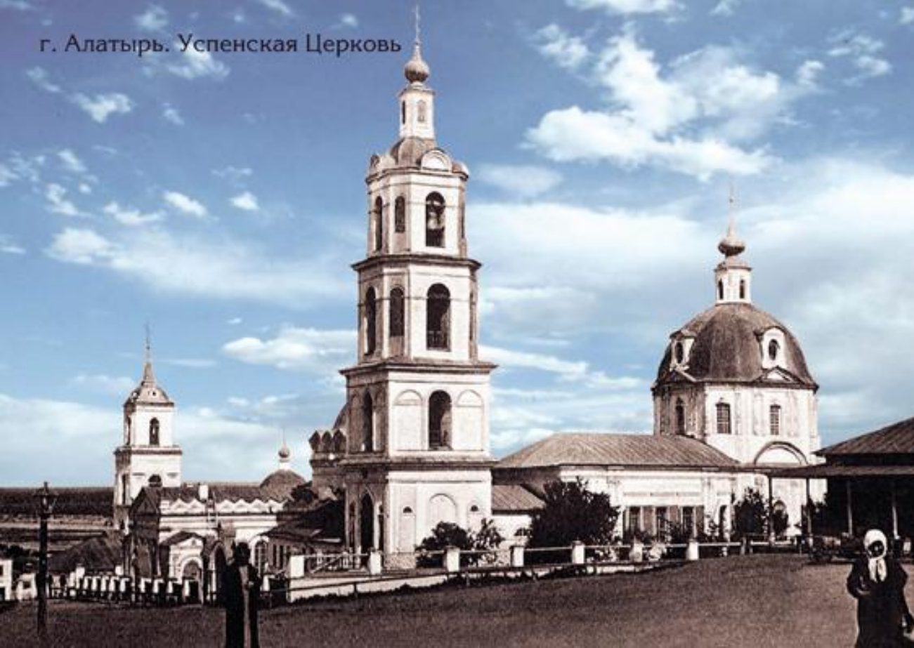
г. Алатырь. Успенская Церковь