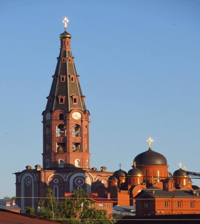
г. Алатырь. Троицкая улица