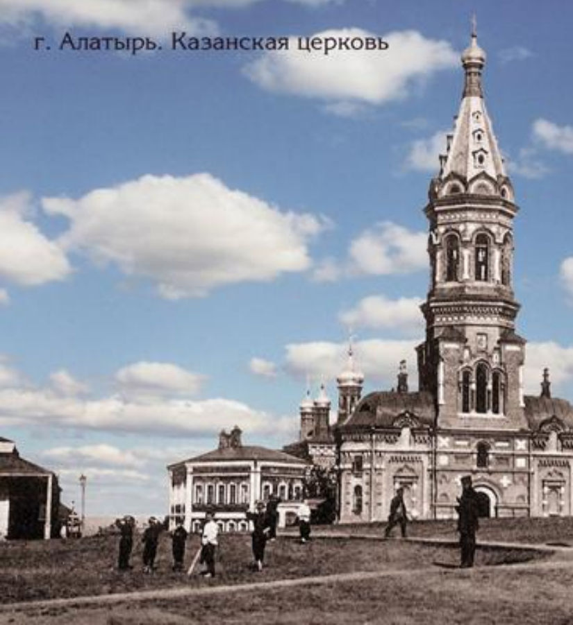
г. Алатырь. Казанская церковь