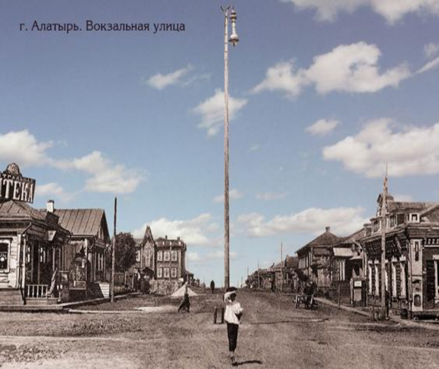
г. Алатырь. Вокзальная улица