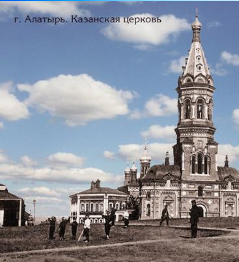
г. Алатырь. Казанская церковь