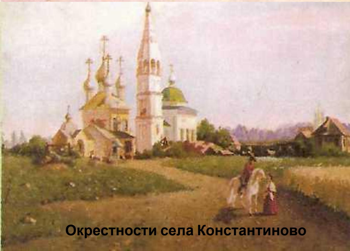
Окрестности села Константиново