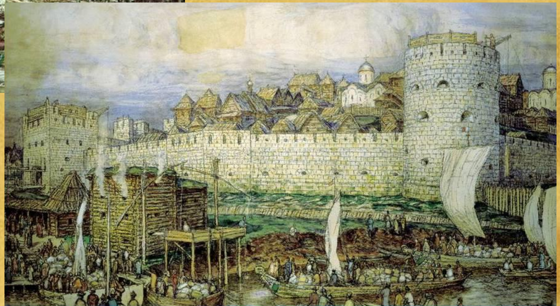
Белокаменный Московский Кремль при Дмитрии Донском С картины А. М. Васнецова

В 14 веке стены заменили белокаменными, но и они были разрушены.