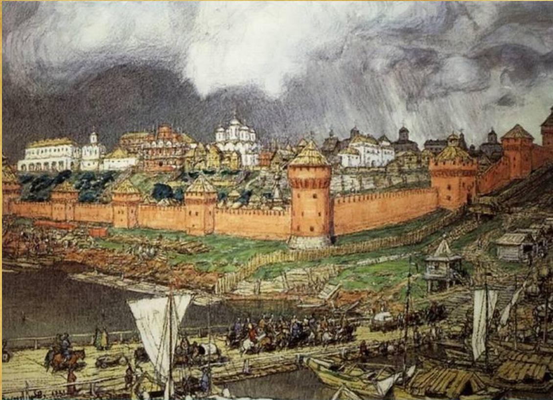
Московский Кремль при Иване III С картины А. М. Васнецова

Стены из красного кирпича возведены в конце 15 века по велению князя Ивана III.