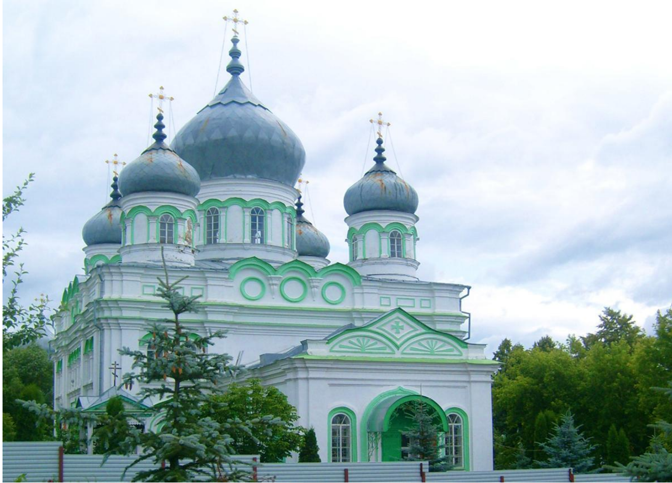
Рузаевский район, с. Пайгарма