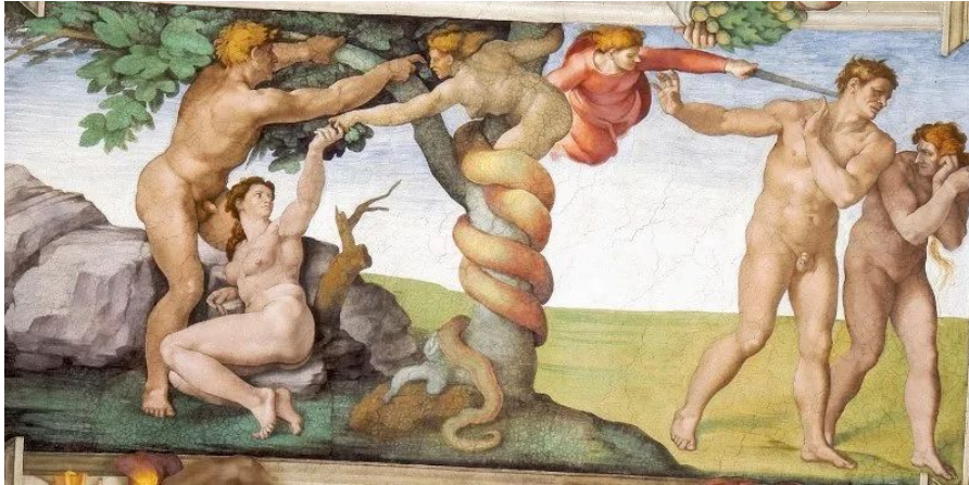
Микеланджело. Изгнание из Рая. Фреска Сикстинской капеллы