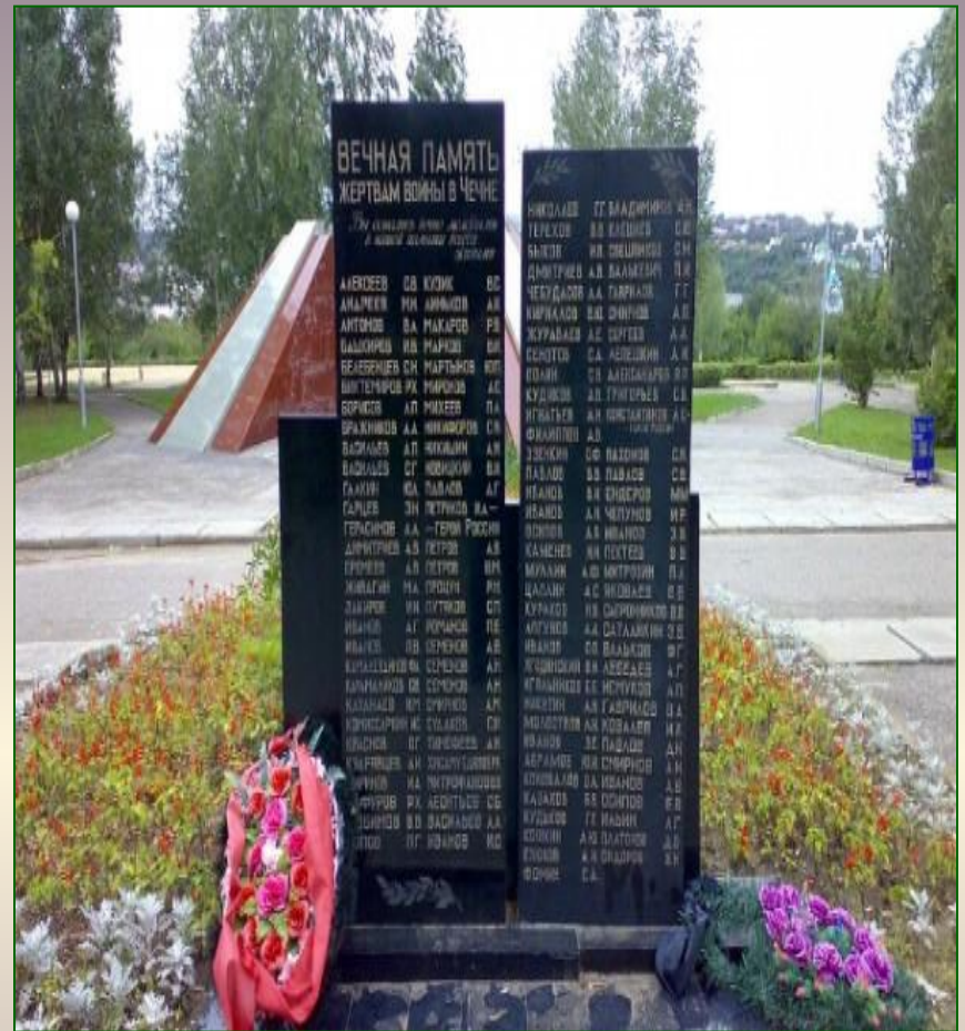
Асӑну аллеинче Афган, Чечня вӑрҗисенче җапӑҗса пуҗне хунӑ салтаксен яҗӑпе мемориал композицийӑсем пур