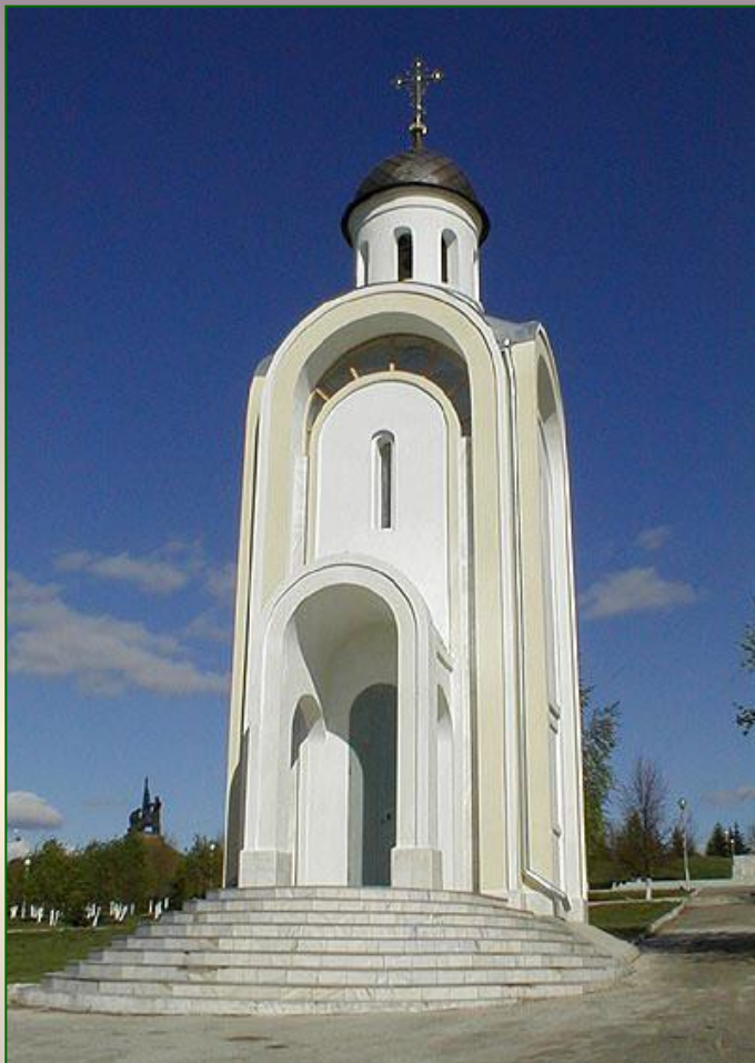
Ѕентеру паркѣнче Ѕветтуй Иоанн часовни ёслет