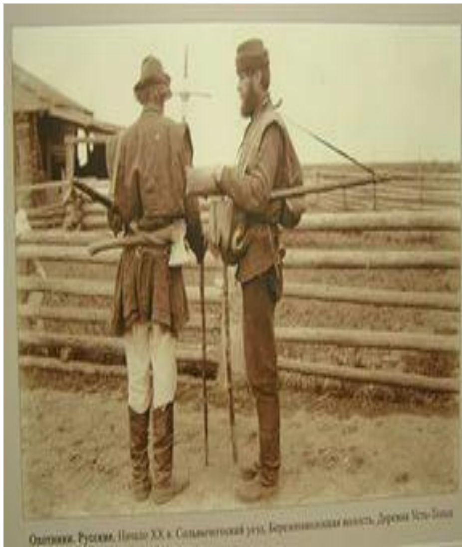
Охотники. Русские. Начало XX в. Сельскохозяйственный уезд, Березинская волость, Деревня Усть-Тала