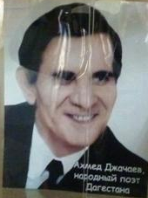
Ахмед Джачаев, народный поэт Дагестана