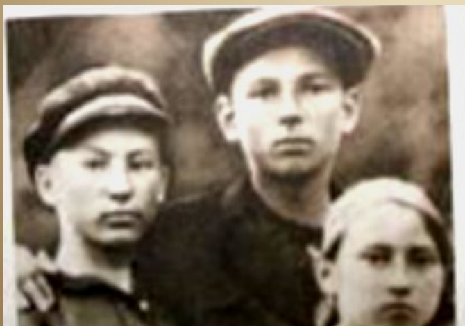
Андрій з братом і сестрою