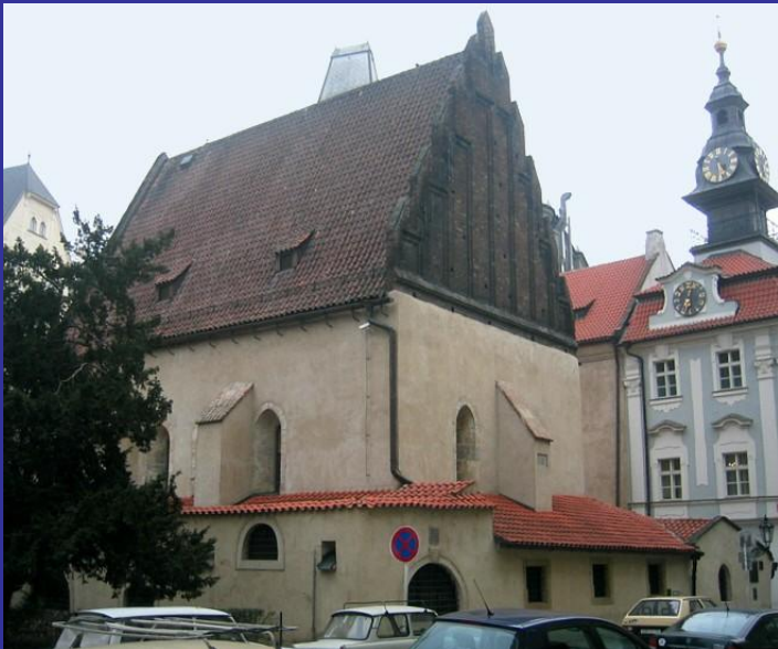
Старонова синагога в Праге, 1270 г. Старейшая действующая синагога в мире