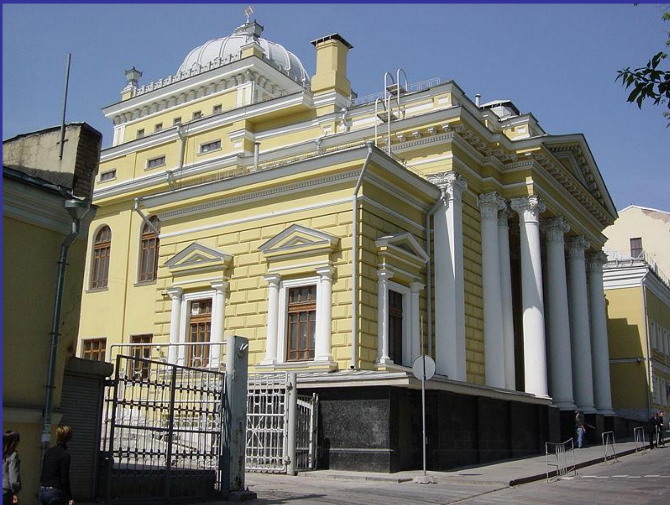
Московская Хоральная синагога