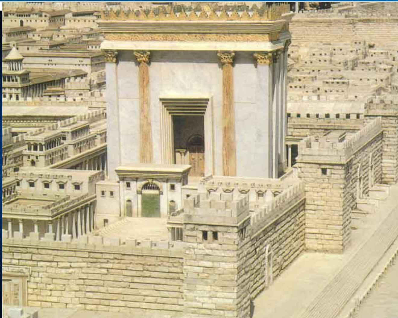
Храм Единого Бога в Иерусалиме