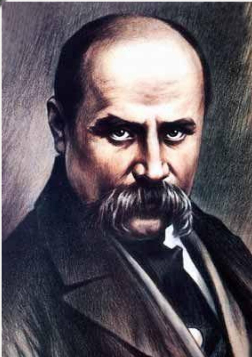
Тарас Григорович Шевченко (1814 - 1861)