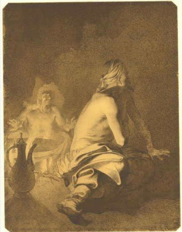
І. КРАМСКОГО «КАЗАХИ БІЛЯ ВОТНОЮ». Сенік. [6. X 1848—2 I II 1849].

23 квітня 1850 р. Шевченка заарештували за порушення царської заборони писати й малювати. Після слідства в Орській кріпості його перевели до Новопетровського укріплення на півострові Мангишлак.