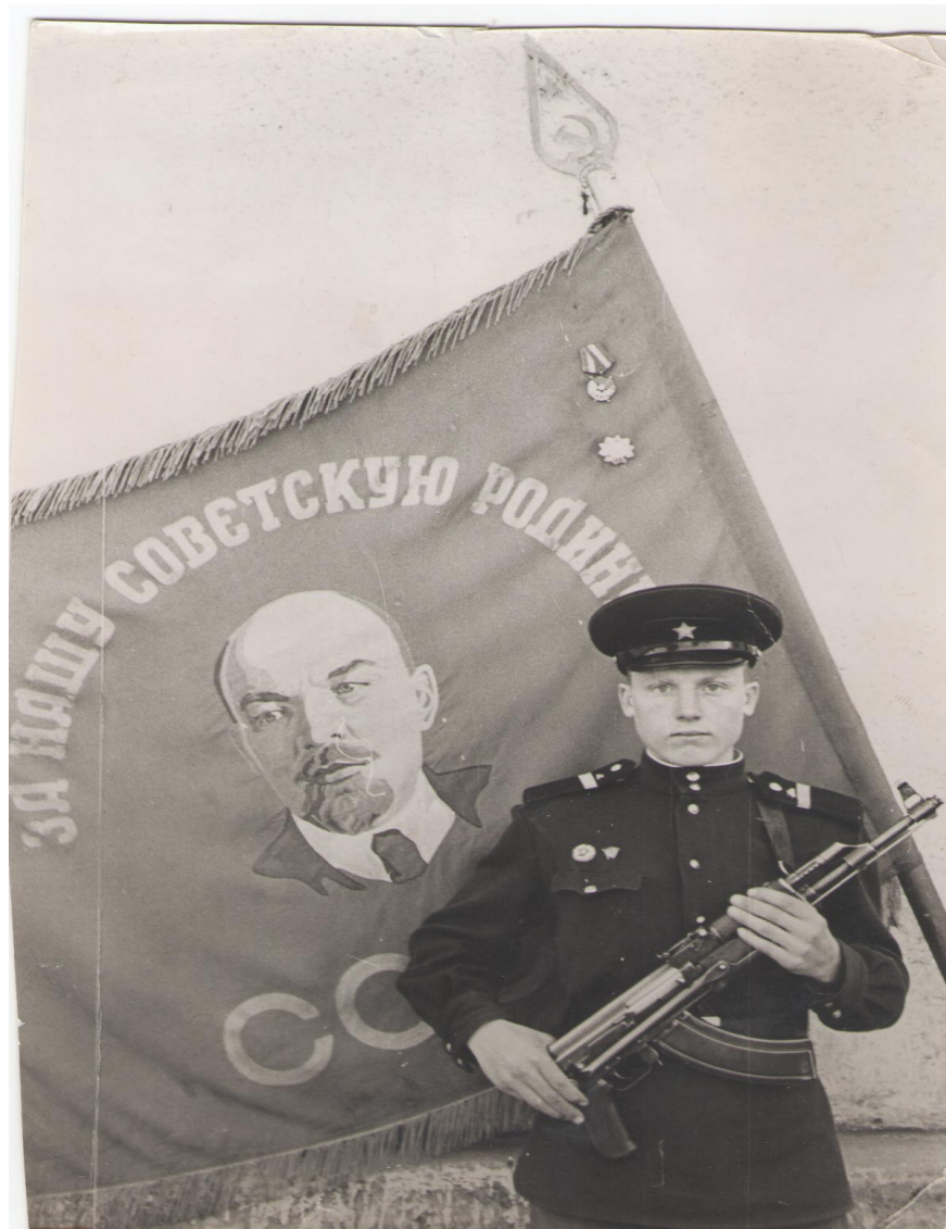
Фото №1 Начало военной службы.