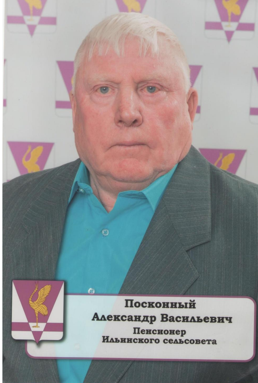
Фото №2 На доске почёта.