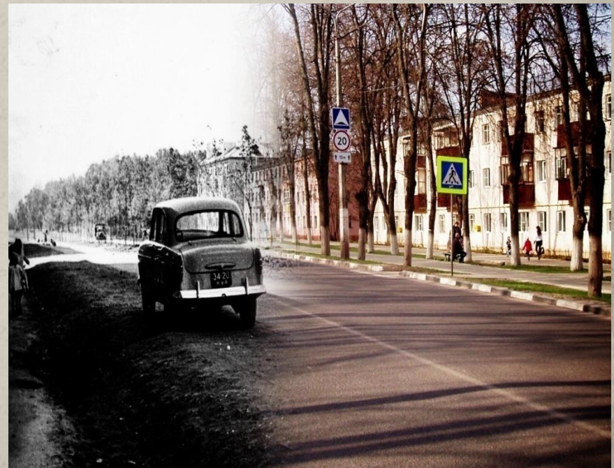
Первые улицы Железногорска