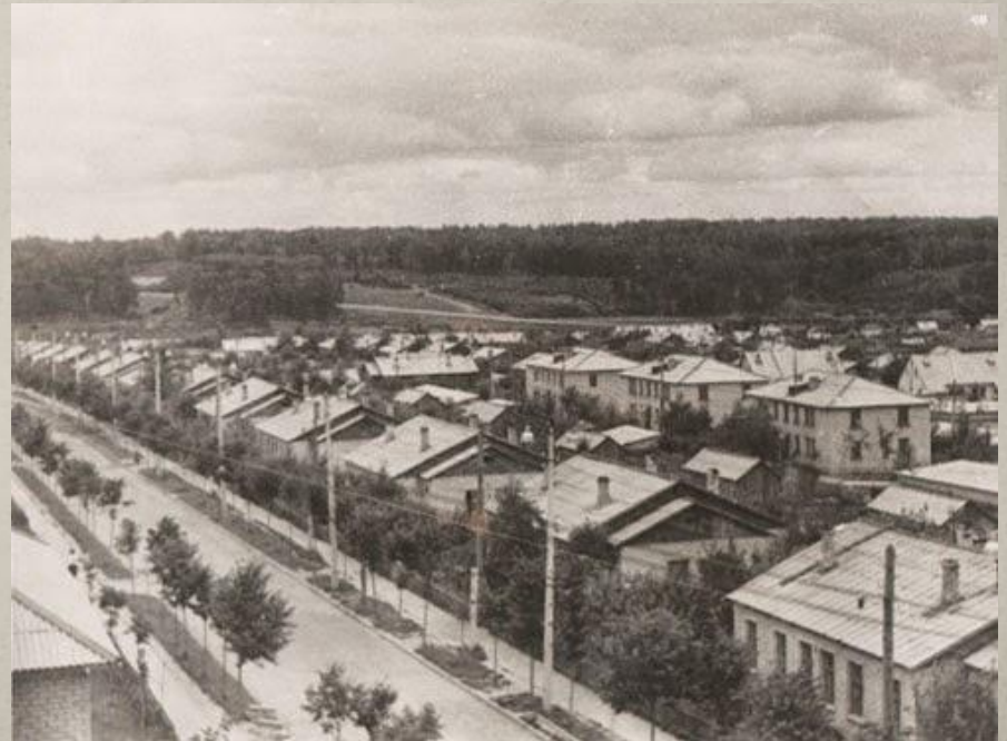
Улица Октябрьская, 1959 год