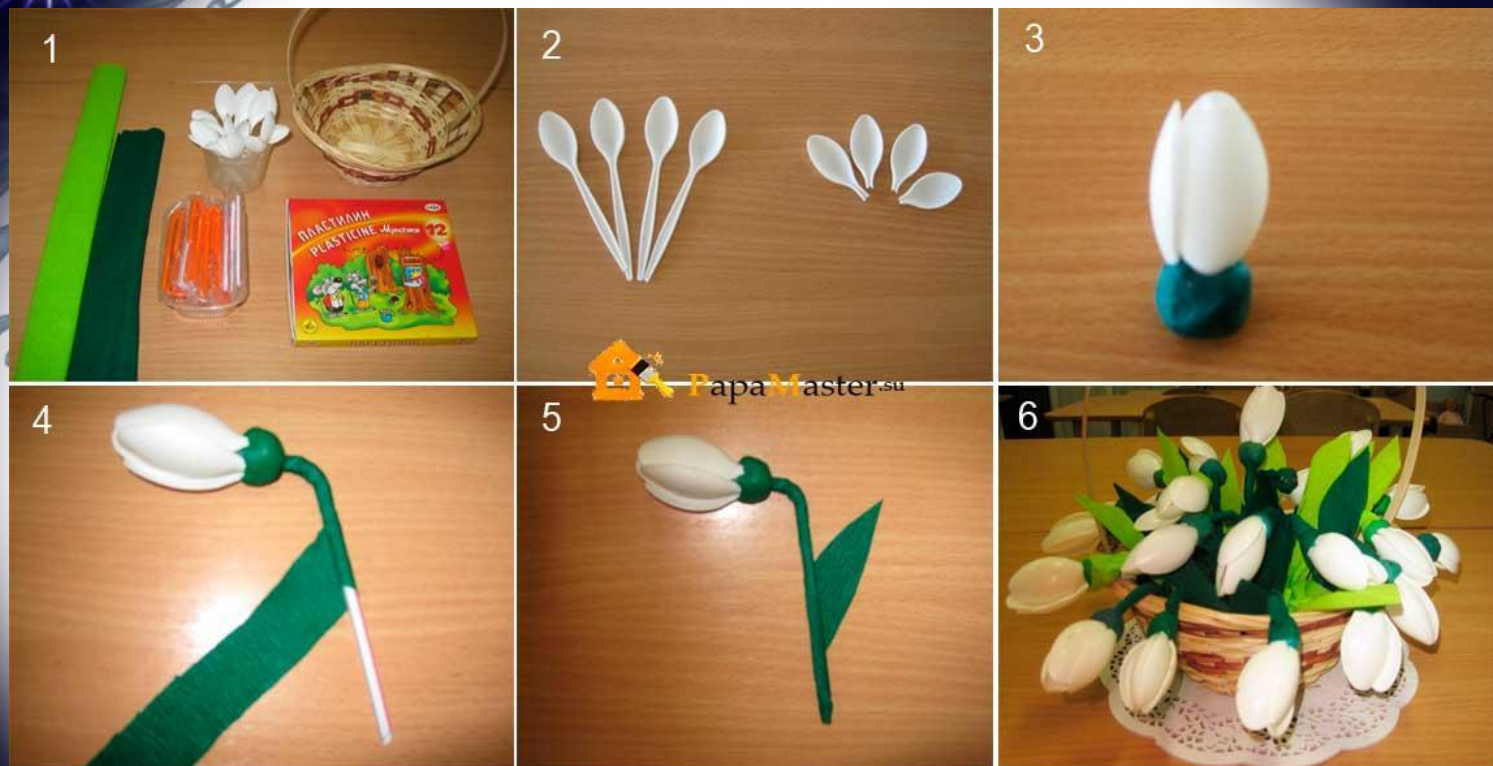
Подснежники своими руками. Этапы работы